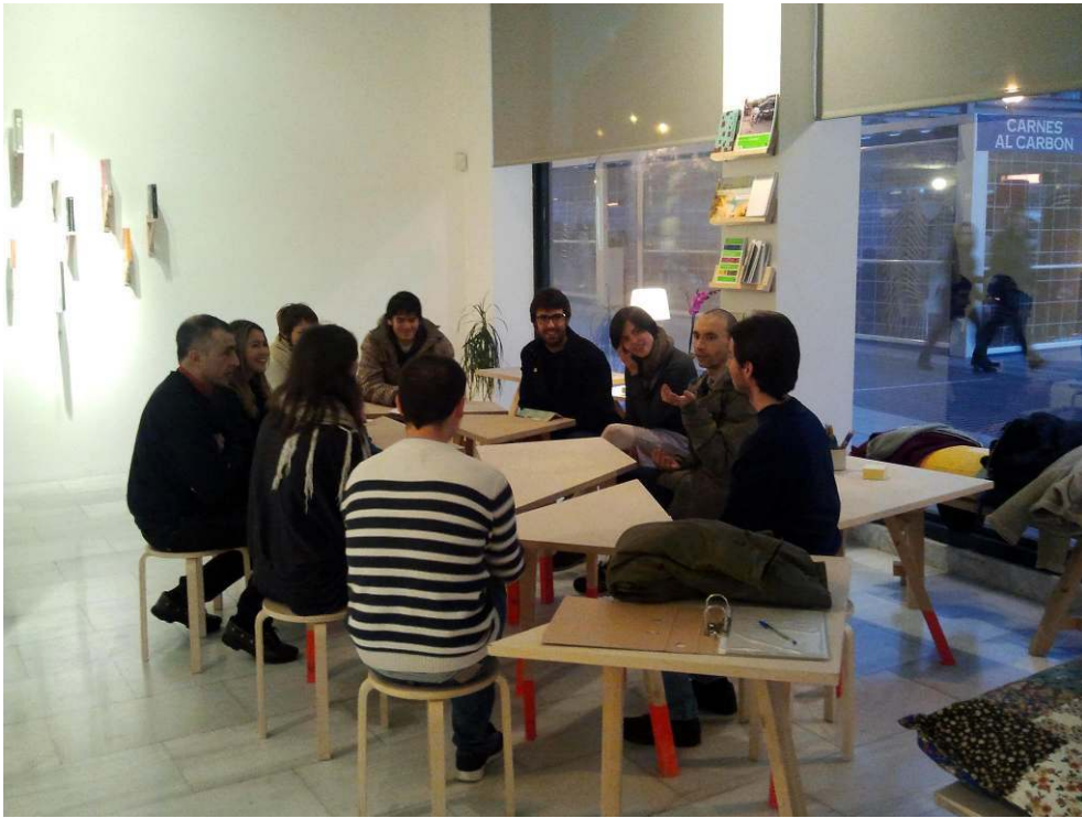
Fig. 3 - Acción-umbral hacer en lo cotidiano 01

elegido por cada uno surgían un montón de pequeñas historias, hábitos, rutinas que lo acompañaban y contaban algo de nosotros.