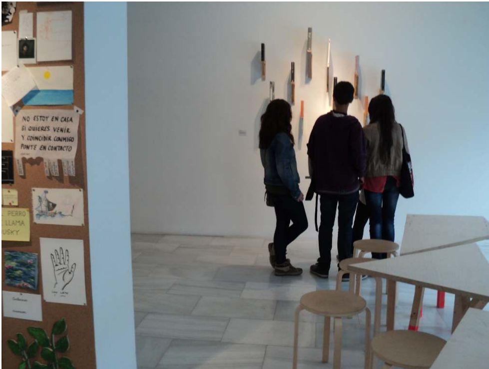
Fig. 5 - Exploración breve de 15 minutos en hacer en lo cotidiano 01