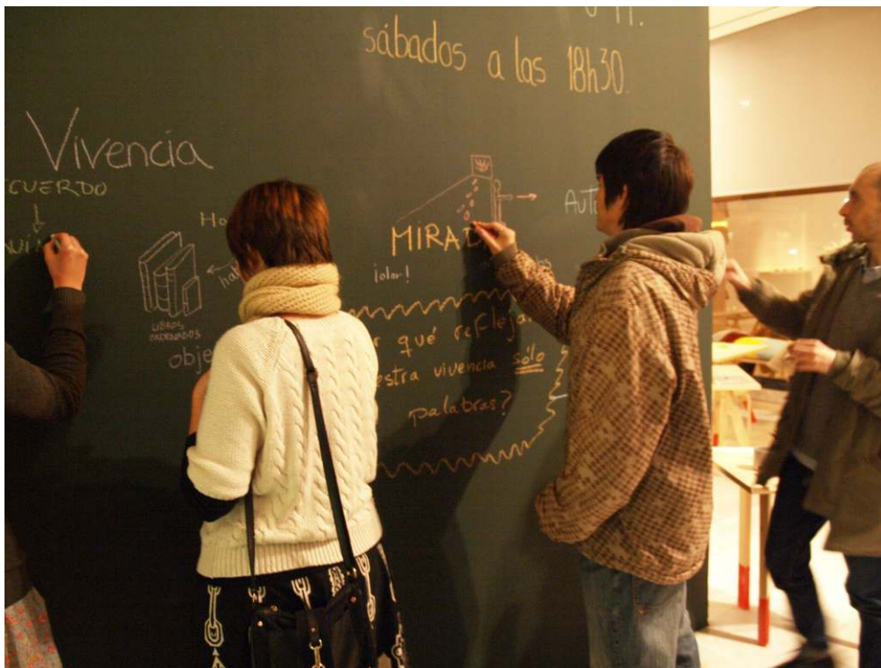
Fig. 8 - CREACIÓN DE MAPA VISUAL