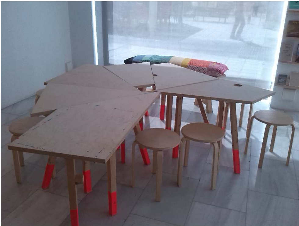
Fig. 2 - Las mesas, bancó y sillas