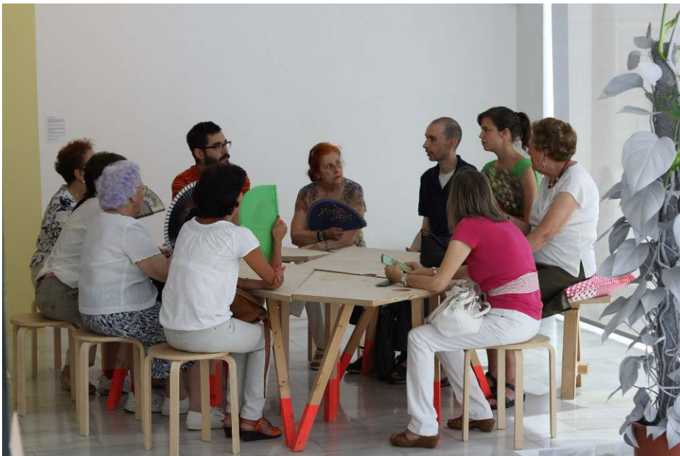
Fig. 4 - Acción-umbral hacer en lo cotidiano 02