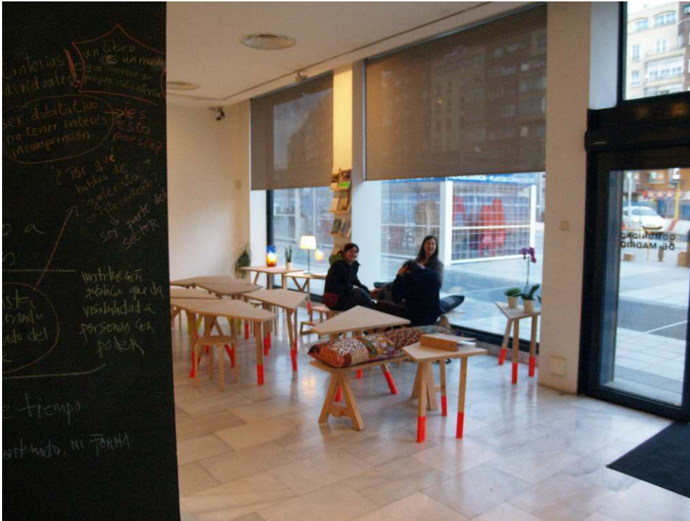
Fig. 1 - Zona de taller y entrada de la exposición

lámparas de mesa. Todos estos elementos hacían de este lugar un híbrido entre una exposición, una sala de estar y un taller de actividades.