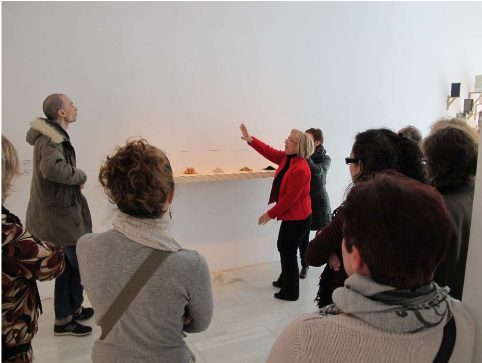
Fig. 6 - Exploración conjunta en hacer en lo cotidiano 01