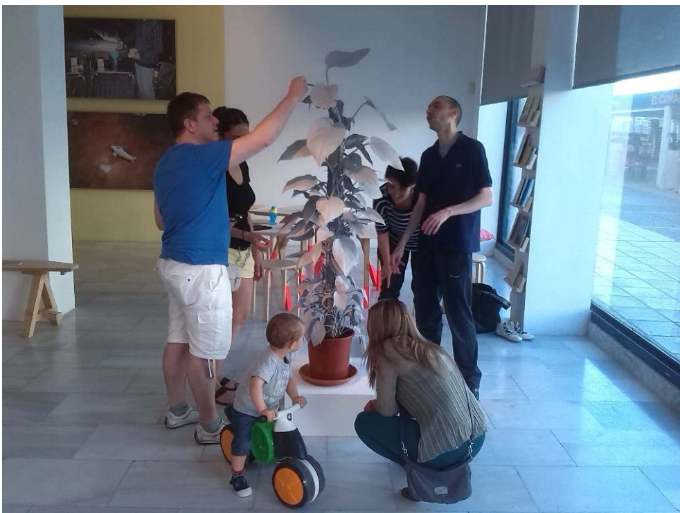
Fig. 7 - Exploración conjunta en hacer en lo cotidiano 02