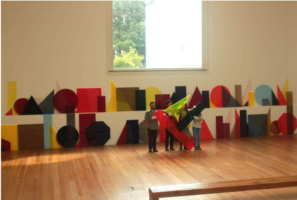
Fig. 7 – Obra A n B n C (line) (2013), de Amalia Pica – Col. Fundação de Serralves, Museu de Arte Contemporânea – na exposição Histórias: Obras da Coleção de Serralves (2014).