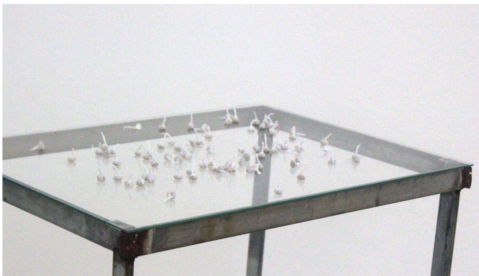
Fig. 6 – Detalhe da obra Black and White (1993), de Lucia Nogueira, na exposição Coleção de Serralves – Forma Conceptual e Ações Materiais (2013).