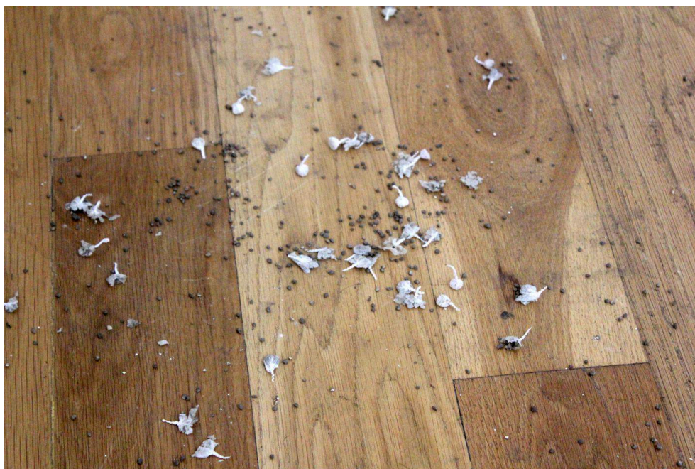
Fig. 5 – Detalhe da obra Black and White (1993), de Lucia Nogueira, na exposição Coleção de Serralves – Forma Conceptual e Ações Materiais (2013).