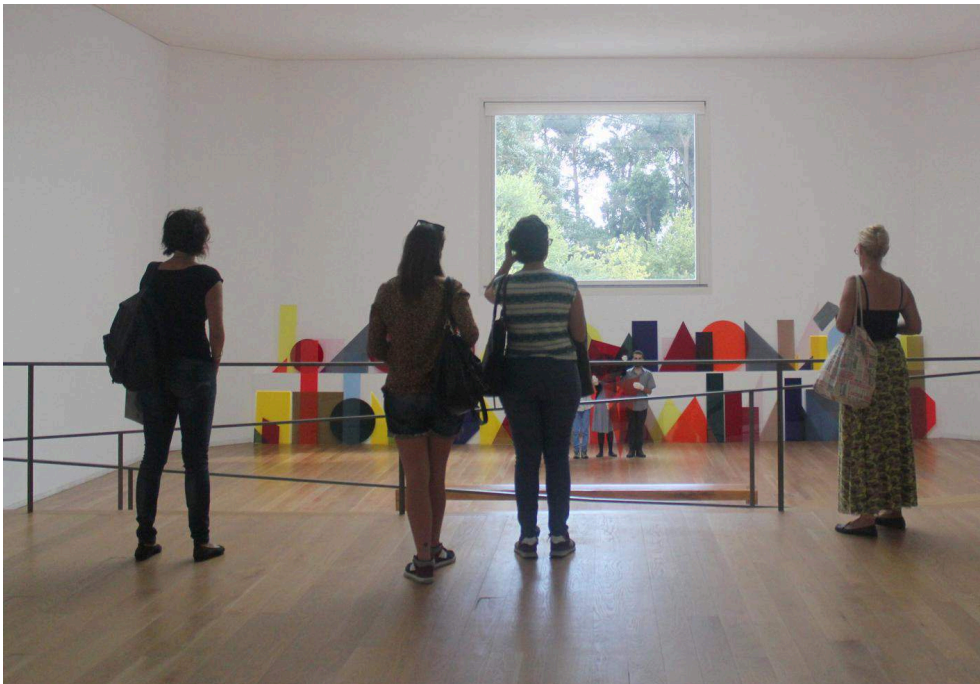
Fig. 8 – Visitantes observando a obra A n B n C (line) (2013), de Amalia Pica – Col. Fundação de Serralves, Museu de Arte Contemporânea – na exposição Histórias: Obras da Coleção de Serralves (2014).