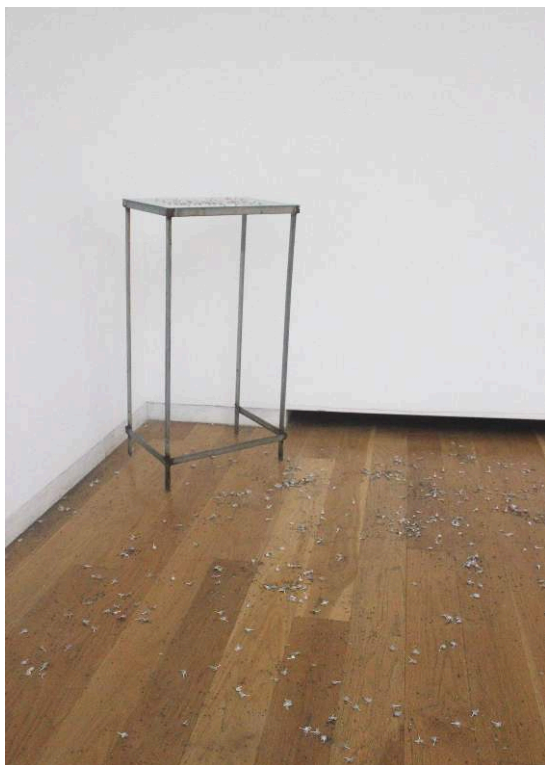
Fig. 4 – Obra Black and White (1993), de Lucia Nogueira, na exposição Coleção de Serralves – Forma Conceptual e Ações Materiais (2013).