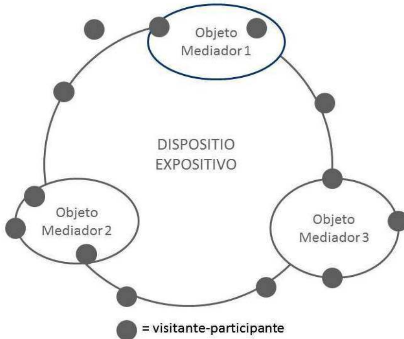
Fig. 3 – Esquema proposto pela autora para explicar a “Realidade Aumentada” em torno de um dispositivo expositivo – inspirado no conceito de modos de visita mediada de Svabo (2010). O objeto mediador cria múltiplos modos de visita e cada visitante personaliza a forma de usar os objetos mediadores, aumentando o espaço da exposição.