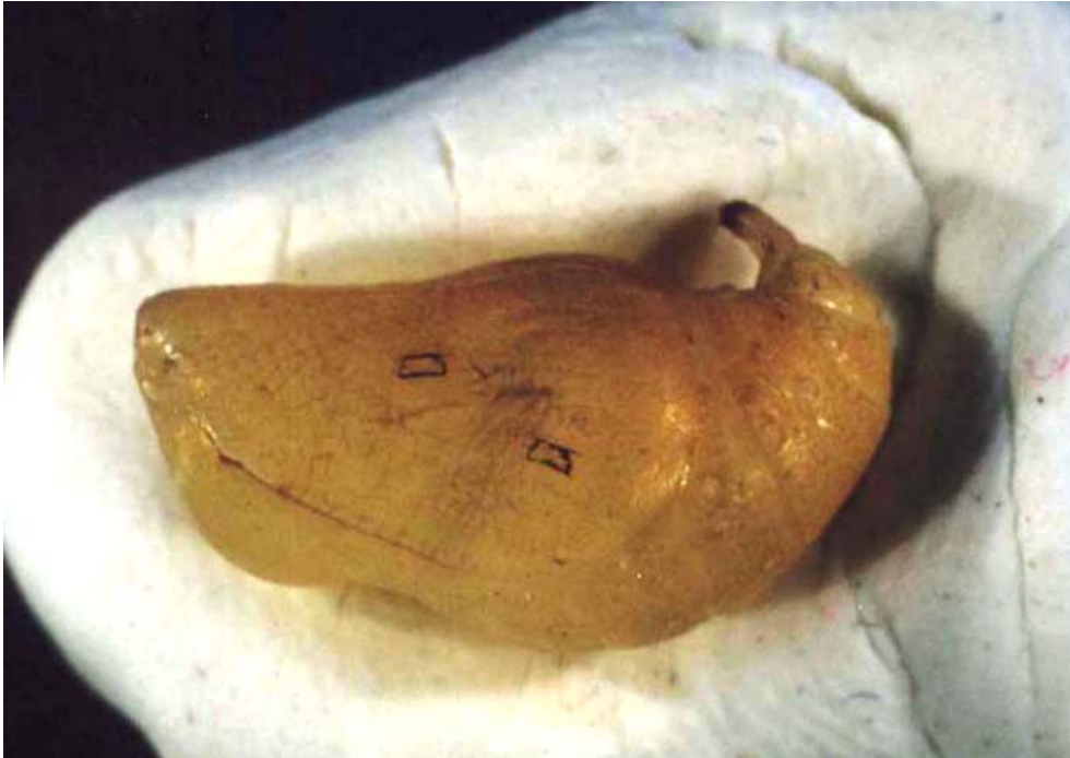
Fig. 3 – Pupa depois da intervenção numa das asas Fotografia de Marta de Menezes, gentilmente cedida pela autora

para outra borboleta, criando novas manchas (fig. 3). Uma vez que não existem nervos nas asas, os procedimentos não causam dor à borboleta. O tecido da asa da pupa recupera após o dano, não deixando quaisquer cicatrizes visíveis na asa do animal adulto (Menezes 2003). Marta de Menezes intervém em apenas uma asa, de forma a realçar a diferença entre a asa intacta e a asa alterada (fig. 4).