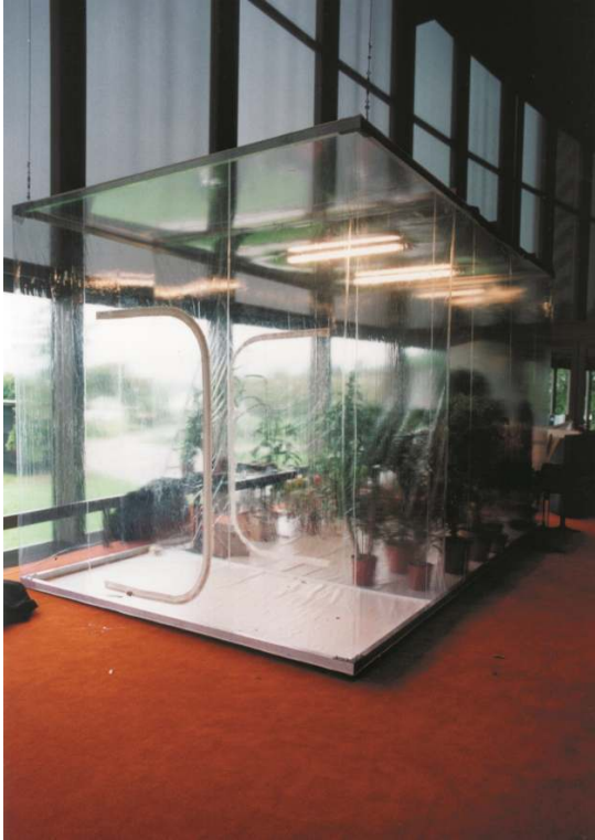
Fig. 5 – Imagem de Nature? na exposição Ars Electronica , em 2000 Fotografia de Marta de Menezes, gentilmente cedida pela autora

com esta realidade levaria mais facilmente a um questionamento acerca do carácter natural ou artificial das borboletas. Isto implicou que a estufa tivesse uma porta dupla, de forma a impedir a fuga das borboletas (fig. 5).