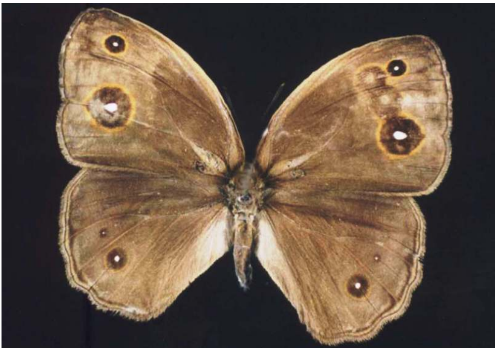
Fig. 4 - Borboleta da espécie Bicyclus anyana , que sofreu uma intervenção na asa direita, mostrando novos ocelos.