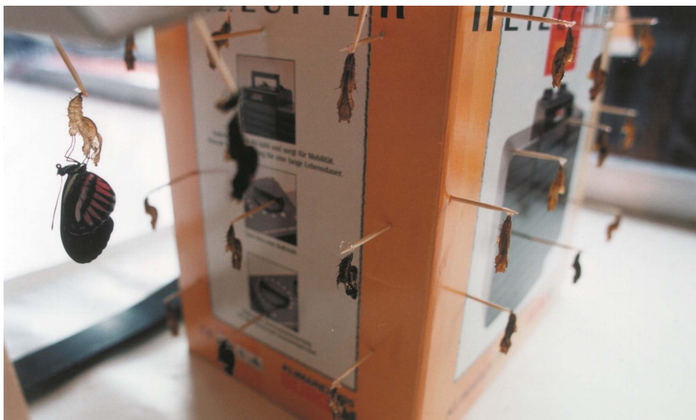
Fig. 7 – Fotografia de uma borboleta acabada de sair da crisálida