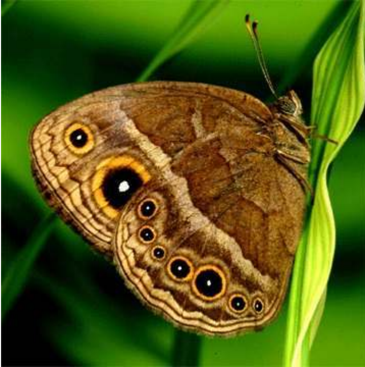
Fig. 1 – Borboleta da espécie Bicyclus anyana