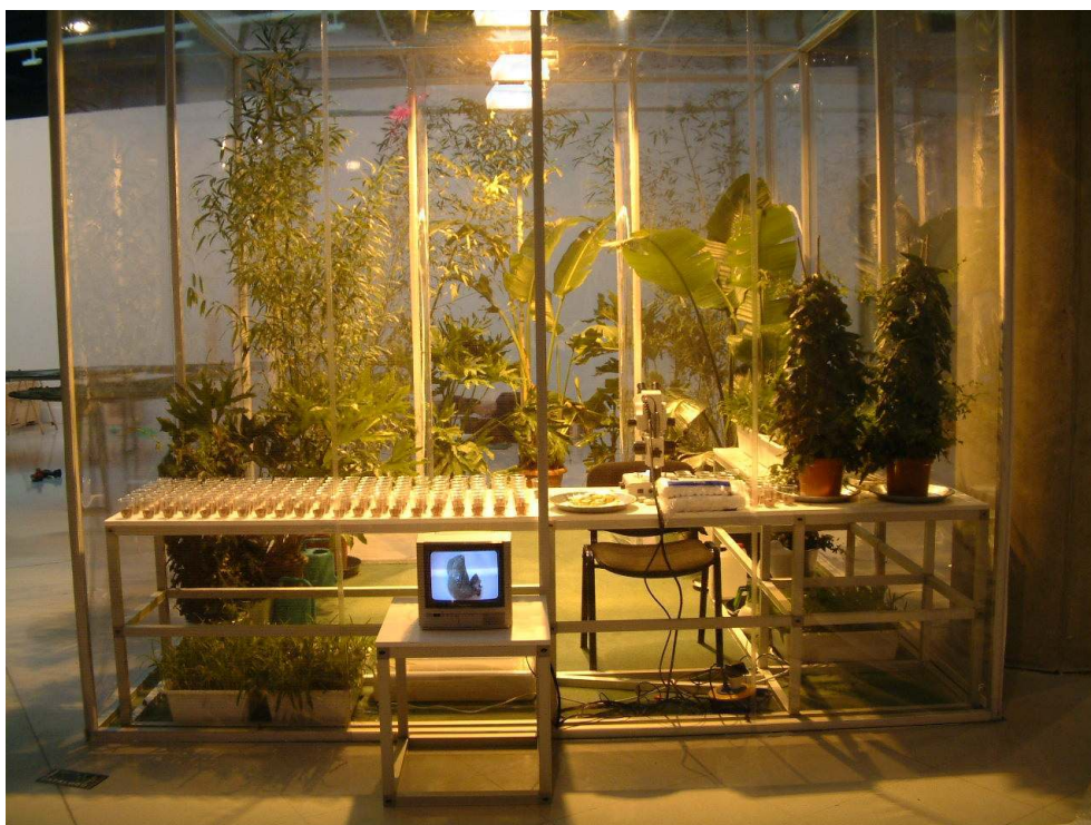
Fig. 6 - Imagem de Nature? na exposição META.morfosis no MEIAC, em 2006 Fotografia de Marta de Menezes, gentilmente cedida pela autora