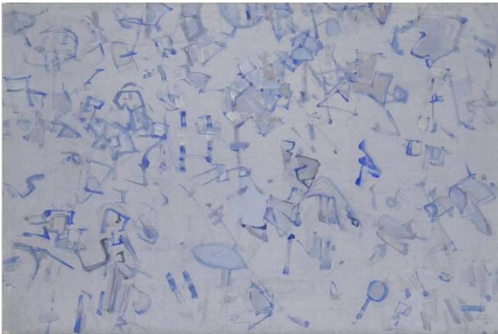
Rive Gauche , 1955 Tempera on paper , 61 × 91 cm