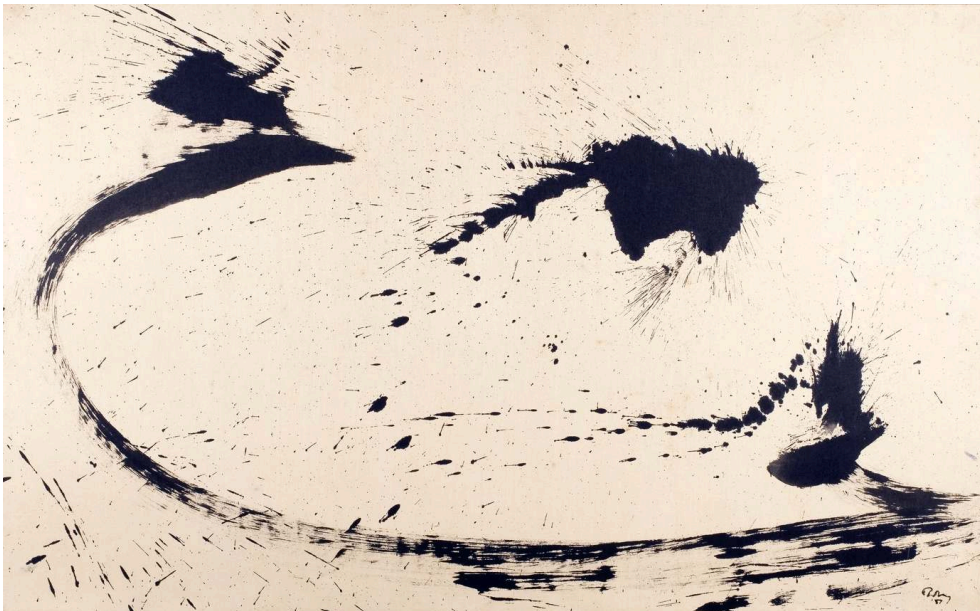
Composition N° 1 , 1957, Encre sumi sur papier marouflé sur toile, 61 x 97,8 cm