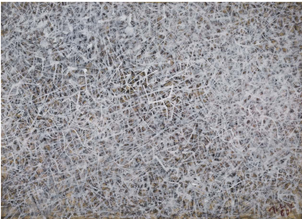
World , 1960, Tempera sur papier, 12.5 x 17 cm