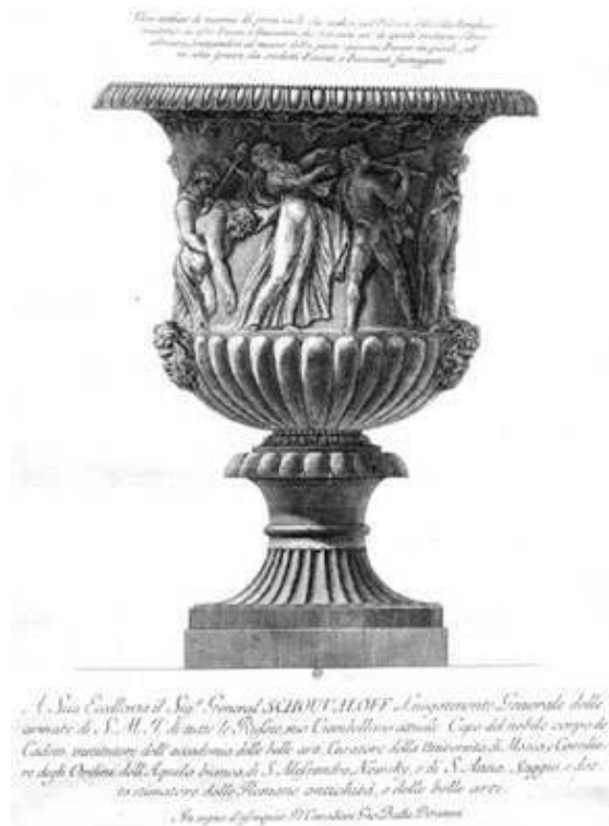
A Sua Eccellenza il Sig. General SCHOUVALOFF, Ambasciatore Generale delle armate di S. M. C. di Russia, suo Consigliere Generale, Capo del celebre corpo de Cavalieri, presidente dell'Accademia delle Belle Arti, Incaricato delle Missioni di Maria Teresa re degli Ordini dell'Impero di Russia, di S. Alessandria, Novorossia, e di S. Anna, Cappella, etc. In occasione della Rivoluzione antichistica, e delle Belle Arti. In Roma il giorno 19. d'Aprile 1778. Gio: Battista Piranesi.