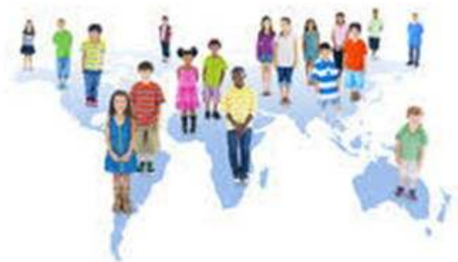
Figure 1 : Remue-méninges

Dans l'analyse des représentations des élèves, nous avons opté pour une analyse thématique, se référant au travail de Negura (2006), afin de dégager des unités sémantiques de base. Les opinions des élèves sont collectées à partir d'une activité Remue-méninges ( brainstorming ) présentant les enfants du monde.