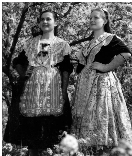
photo 1 : Groupe folklorique de Tortosa Folkloric group of Tortosa

Grupo folklórico de Tortosa