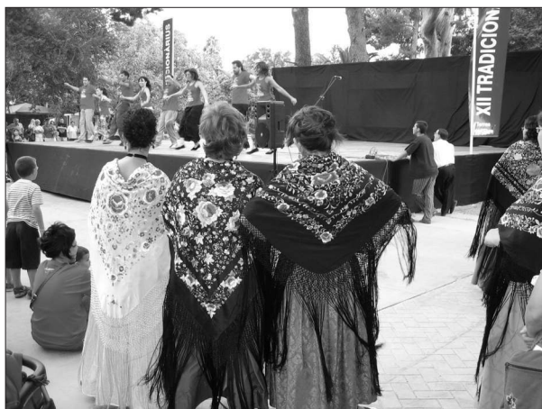
Photo 2 : Danseuses en costume de Horta de Sant Joan observant avec intérêt la représentation du groupe régional Saragatona , Festival de danses traditionnelles du Tradicionarius , Roquetes, août 2005

Dancers with costume of Horta de St Joan, observing the show of the regional group Saragatona, Festival of traditional dances of Tradicionarius, in Roquetes, August 2005