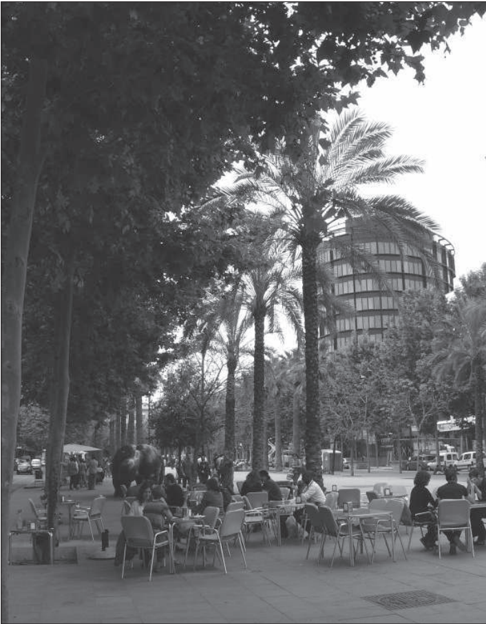
Photo 1 : Un hôtel de luxe sur la Rambla del Raval : une aberration ou un symbole du changement ?

A luxury hotel on the Rambla del Raval : an aberration or a symbol of change ?