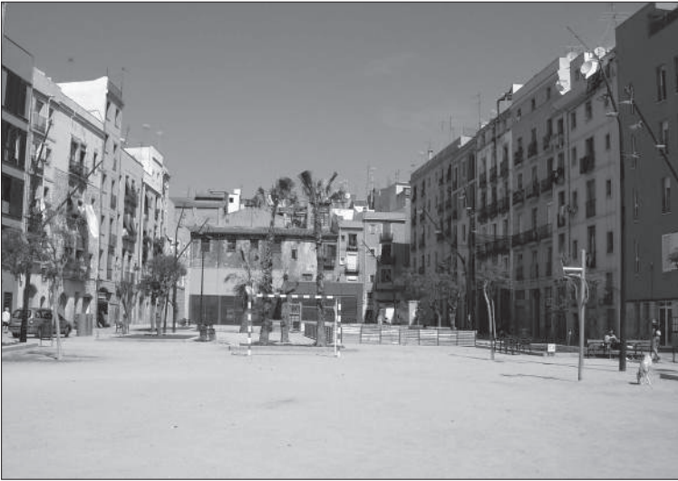
Photo 2 : La rénovation du secteur Pou de la Figuera: une récupération politique dégradée du projet des riverains

The renovation of the Pou de la Figuera sector. A degraded political recuperation of the project of the residents.