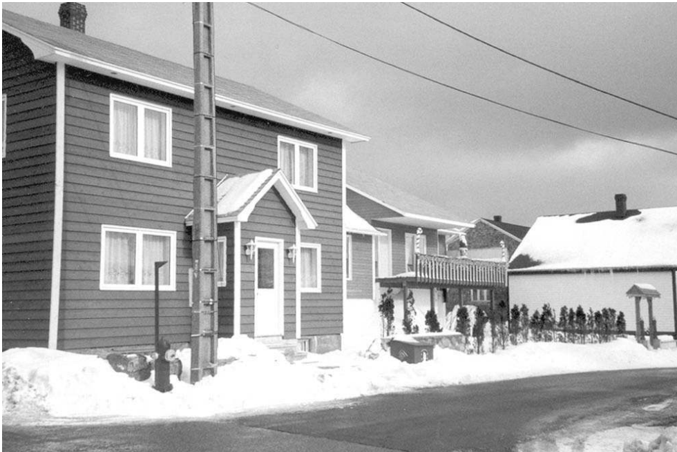
Photo 1 : une rue de Saint-Pierre : paysage urbain nord américain et norme française représentée par le poteau électrique