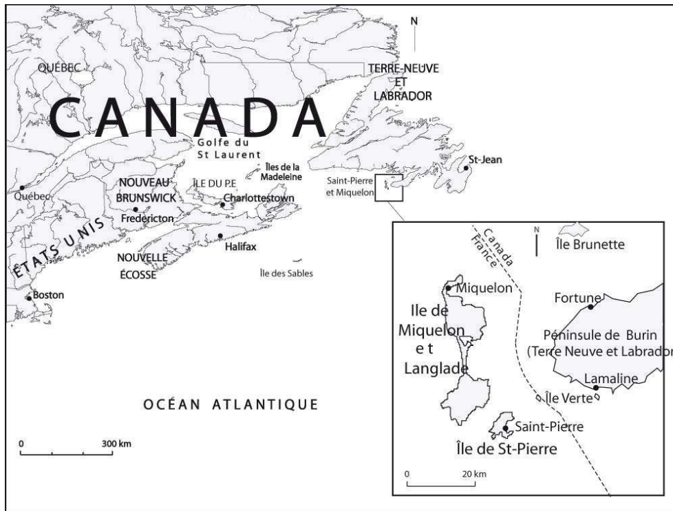
Figure 1 : La situation de Saint-Pierre et Miquelon