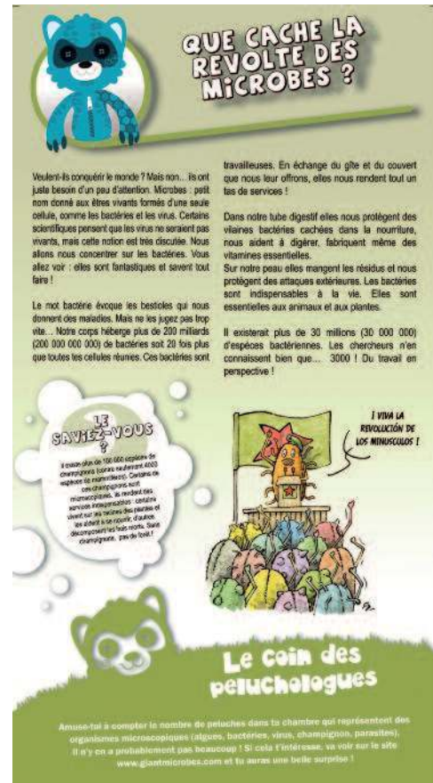
Que cache la révolution des microbes ?, un exemple des panneaux d'exposition Mission peluches © Université Montpellier 2/illustration et PAO : François Dolambi

Depuis 2010, différents événements ont fait évoluer la peluchologie (les éditions de la Fête de la Biodiversité