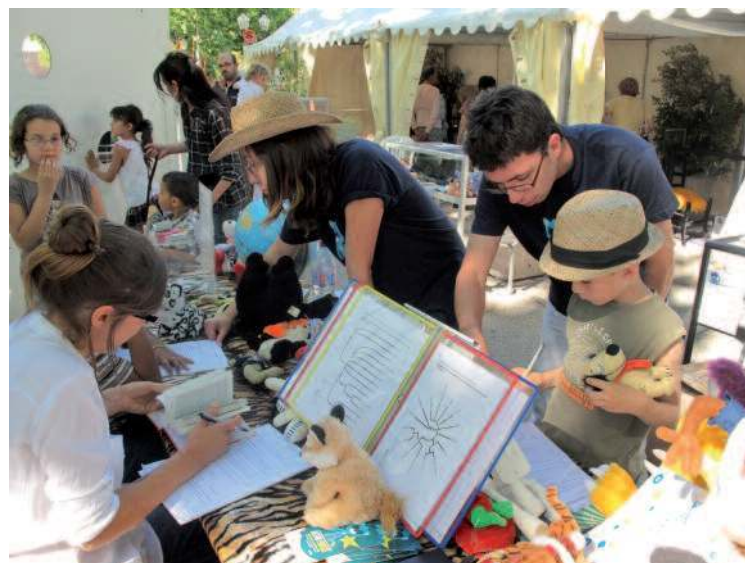
Peluchologues en pleine expertise, sur le stand de la Société Française de Peluchologie lors de la Fête de la Biodiversité 2011, organisée par la Ville de Montpellier.

En terme d'apprentissages scientifiques autour de la classification, les étapes sont progressives. L'accent est d'abord mis sur l'observation (unité et diversité, de l'oral à l'écrit). Petit à petit, la démarche de classement émerge. Il faut alors distinguer : trier (faire