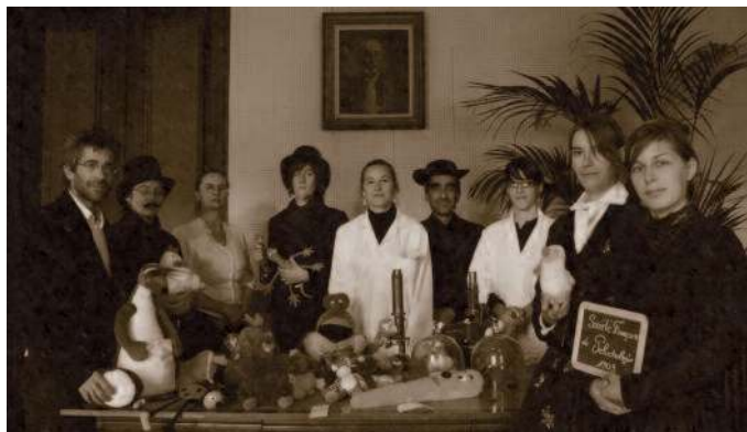
Inauguration de la Société Française de Peluchologie en 1903 (salle des Actes de l'Institut de Botanique, Montpellier).