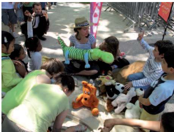
La classification de peluches en direct (Fête de la Biodiversité 2010), Est-ce que cette peluche ressemble plus à un hippopotame ou à un crocodile ? : dilemme à résoudre.

des groupes qui partagent le plus de caractères possibles. Comme dans le vivant, la classification basée sur un échantillon doit être testée avec l'apport de nouvelles peluches. Les groupes établis seront alors modifiés (éclatés ou subdivisés), à l'image de l'évolution de la classification du vivant. Cette notion de connaissances en évolution constante est importante à souligner.