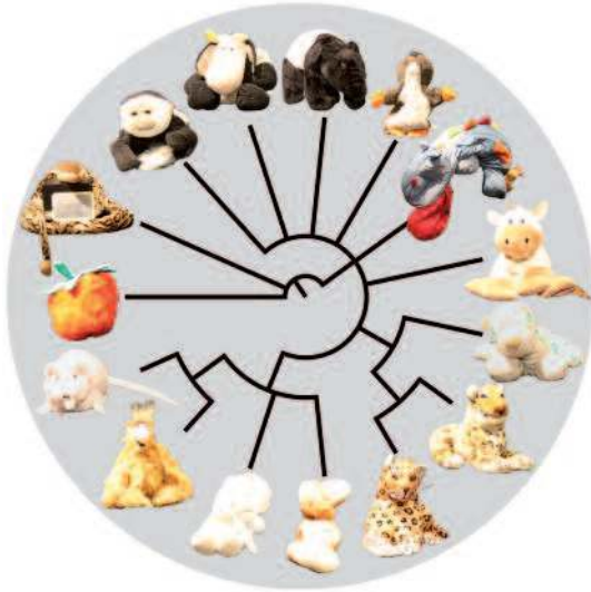
La première classification de peluches élaborée collaborativement entre peluchologues et chercheurs de l'Institut des Sciences de l'Évolution de l'université Montpellier.