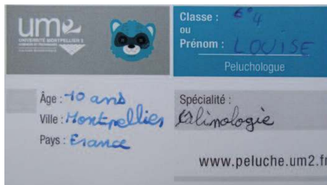
Carte professionnelle d'une peluchologue, Louise, 10 ans spécialisée en câlino-logie.

C'est à partir de cette méthode cladistique que l'animation sur la classification des peluches a été créée. Pour les peluches, on ne parle pas de lien de parenté au sens strict (4) . La classification des peluches consiste à déterminer des caractères pertinents et observables sur les objets-peluche, puis à constituer