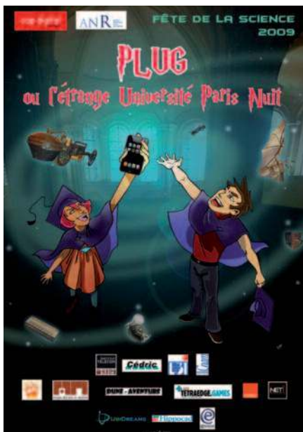
Un des deux jeux déployés dans le cadre du projet PLUG.