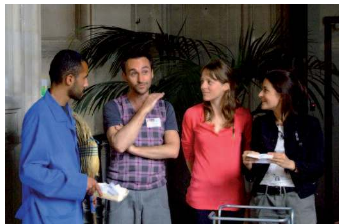
La restitution des connaissances acquises par les joueurs lors de la grande scène finale.

Lors de la scène finale, les joueurs font face à la Grande Z, M. Picard et la Directrice de l'UPN. Cette dernière leur raconte la genèse et les objectifs de cette université parallèle : former les meilleurs étudiants qui soient pour en faire des inventeurs de génie dont l'inspiration se nourrirait des inventions passées. Chaque équipe est appelée à la barre d'un tribunal pour répondre à l'ultime énigme : restituer leur parcours de jeu en résumant le lien entre l'objet contemporain (l'objet cible) et l'un des objets ancêtres (objets intermédiaires). Chacun doit enfin argumenter son désir d'intégrer l'UPN. La directrice est seule juge d'admettre ou non les différents candidats à l'université, après avoir pris conseils et avis auprès de la Grande Z. Avant que tout le monde ne se sépare, la Directrice fait prêter serment à tous les joueurs de ne jamais dévoiler le secret de l'UPN et d'utiliser la