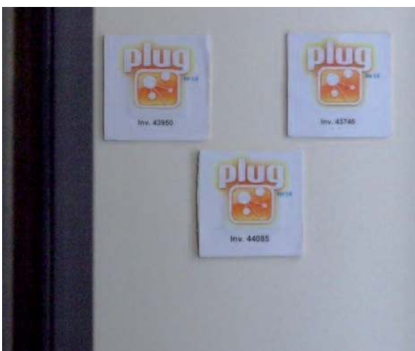
Chaque objet était identifié par son numéro d'inventaire sur les tags RFID.

Des rencontres impromptues entre équipes ont été imaginées pour consolider le lien social entre les visiteurs-joueurs. Créer des occasions de rencontres maintient une équipe dans le rythme du jeu et évite le risque d'un jeu trop monotone. Par exemple, lorsqu'une équipe était en retard, le Maître du Jeu la convoquait ainsi qu'une autre pour qu'elles s'affrontent dans le cadre d'une joute. Chaque membre de chaque équipe mimait un objet du musée sans que les autres participants, y compris ceux de son équipe, le connaissent. L'équipe ayant reconnu le plus d'objets gagnait la partie et le droit de pirater le cartable