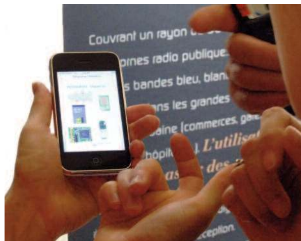
Une riche documentation est disponible dans le smartphone et au centre de documentation du musée.

Pour chaque « objet intermédiaire », une question technique, scientifique ou historique était posée en lien avec l'« objet cible ». Pour développer un apprentissage actif, notre objectif était que le joueur n'ait pas simplement à choisir des solutions préparées mais qu'il dispose de documentation lui permettant de répondre à toute question posée sur un objet. De la riche documentation multimédia était disponible dans le terminal mis à la disposition des joueurs (un iPhone) ou au centre de documentation du musée.