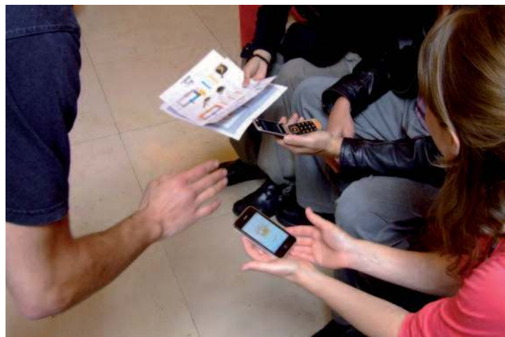
Les joueurs en pleine chasse au trésor