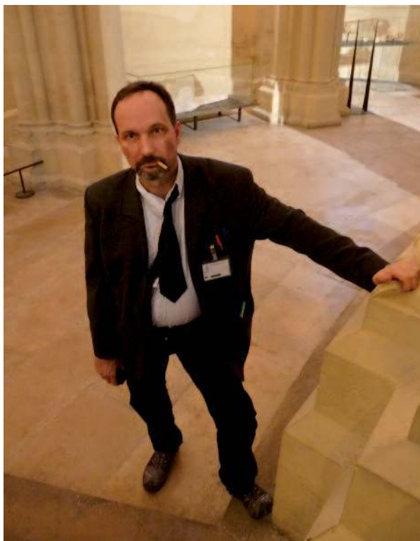
L'univers de PUPN : des comédiens dans des lieux insolites

multiples épreuves à passer pour cela, avec notamment une épreuve finale d'envergure face à la Directrice. Puis la Grande Z, présidente de l'incontournable Bureau des Élèves, les accueille de façon bienveillante tout en leur remettant l'ensemble des équipements dont ils auront besoin pour passer les épreuves, et qui composent le « cartable électronique ». Elle leur explique également la joute, une tradition officieuse et spécifique à l'université.