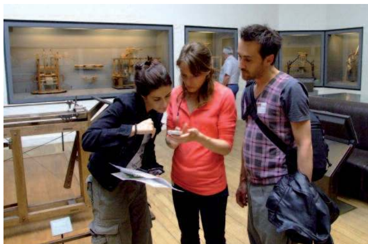
Les joueurs de PUPN sur le terrain

Par ailleurs, d'un point de vue comportemental et sociologique, il a été instructif de noter l'attitude des joueurs face au commissaire de police lors de la dernière scène du jeu : ont-ils ou non dévoilé le secret de l'UPN au commissaire ? Dans la majorité des cas,