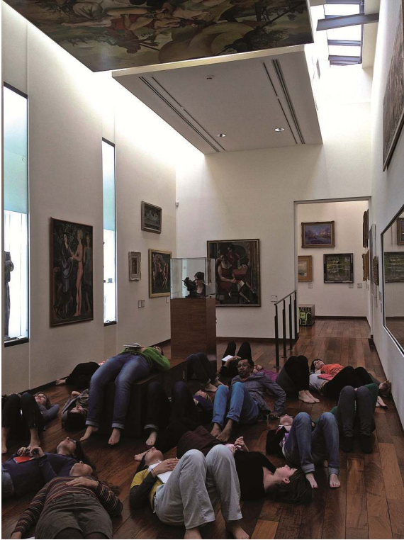
Atelier « Parcours des sens » mené avec les étudiants du master expographie de l'université d'Artois au musée de La Piscine à Roubaix en 2012.