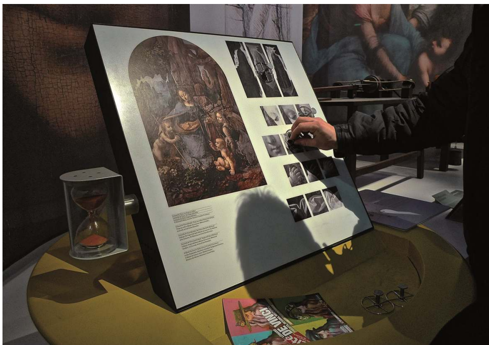
Présentation interactive dans l'exposition Léonard de Vinci, projets, dessins, machines proposée en 2013 par la Cité des Sciences et de l'Industrie, Universcience.