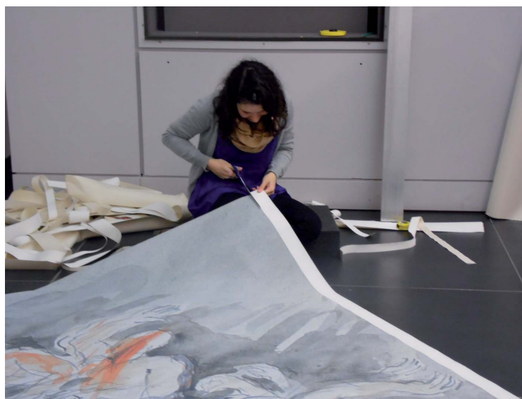
Les stages permettent notamment aux étudiants de participer au montage d'exposition comme ici au musée régional d'Ethnographie de Béthune pour l'exposition Epilepsie, mythes et préjugés .

Dans l'idéal, une mission de stage est d'autant plus appréciée qu'elle est clairement énoncée, bien définie et qu'elle donne lieu à un travail visible. Si le travail de coordination est évidemment utile, il est souvent ingrat en cela qu'il supplée à biens des fonctions sans produire un résultat visible. La succession de tâches morcelées, supplétives, peut s'avérer frustrante pour tous. Offrir une mission qui produit un travail identifié comme étant celui réalisé par le stagiaire est évidemment plus gratifiant. Pour éviter toute confusion, il est préférable que le stagiaire se voit confier une mission