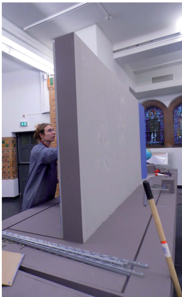
Montage de l'exposition Epilepsie, mythes et préjugés , au musée régional d'Ethnographie de Béthune par une étudiante du master MEM

Évidemment la reconnaissance passe également par le fait de rendre à César ce qui lui appartient. Un stagiaire sera gratifié si le lieu l'associe aux choix, lui réserve une vraie place, écoute ses propositions et prend en compte ses observations (10) . Mentionner le travail