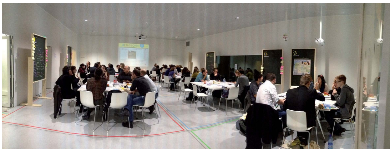
La manifestation Muséomix en Nord, organisée au Louvre-Lens et coordonnée par un groupe projet du master MEM.

Le lieu de stage doit mettre sur le papier, souvent pour l'offre de stage, ou dans une sorte de cahier des charges, ce qu'il attend du stage, le contenu de la mission, les conditions et les moyens pour ce faire. C'est une façon pour le lieu de stage de clarifier ses attentes, et ce sera la base du contrat à conclure entre le lieu d'accueil