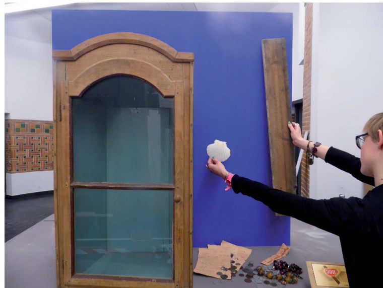
Montage de l'exposition Epilepsie, mythes et préjugés, au musée régional d'Ethnographie de Béthune

Enfin, il faut rappeler combien le stage n'est, en principe, qu'un mode parmi d'autres de la professionnalisation. Il s'accompagne d'autres opérations, et parfois d'autres exercices, comme par exemple des projets tutorés, des diagnostics ou des réponses à des commandes de la part d'institutions ou d'entreprises. Les occasions de collaborations sont donc nombreuses et diversifiées entre le lieu de formation et les professionnels.