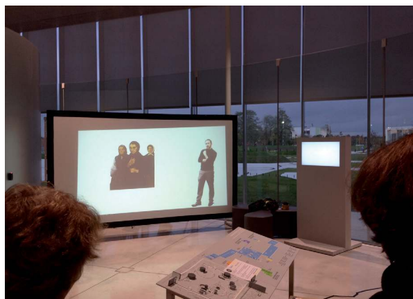
Muséomix en Nord au Louvre-Lens

Durant le stage, il n'est pas rare que les missions évoluent du fait des circonstances, des aléas, des opportunités. Ceci n'est pas problématique, si l'on peut le formaliser en toute connaissance de cause. En revanche, le cahier des charges établi précédemment pourra servir de repères pour s'y reporter en cas de dérives des parties prenantes. Cela permet d'éviter le stage aux promesses extraordinaires qui se réduisent progressivement aux photocopies et à la machine à café ! Cette vision caricaturale n'est pas citée par hasard, mais parce que le stagiaire a été trop souvent mal choisi ou que le stage a été insuffisamment préparé. Préparer un stage est un travail, qui sera d'autant plus satisfaisant qu'on l'aura accompli de part et d'autre avec sérieux.