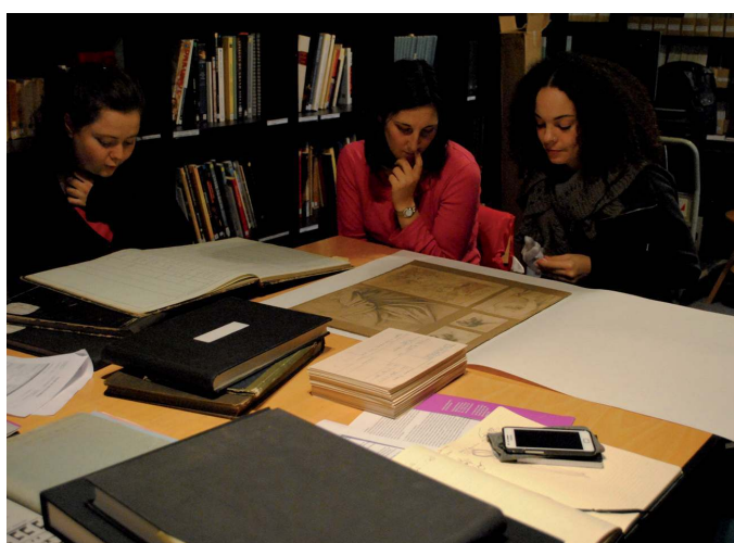
Participation d'étudiantes du Master Expographie-Muséographie (MEM) de l'université d'Artois au travail de récollement au musée des Beaux-Arts de Valenciennes

Partant des nombreuses dérives observées lors des stages, l'auteur propose une sorte de vade-mecum du stage dans les institutions muséales, un répertoire des bonnes pratiques pour faire de cette étape du parcours universitaire un moment privilégié pour expérimenter, se confronter à la réalité du terrain, valider des connaissances en compétences.