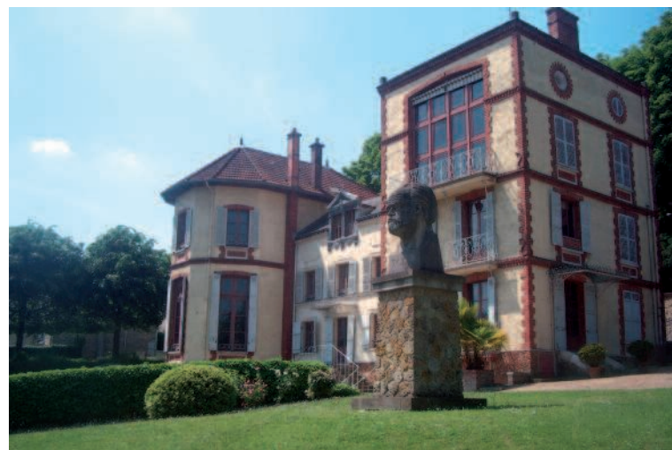
La Maison Émile Zola à Médan (78)

Intrigué, en entrant dans la salle de billard chez Émile Zola, le visiteur tente de regarder au travers des vitraux rigides et colorés pour y entrevoir l'extérieur, une vision transfigurée du paysage. L'approche muséographique utilise aussi les lignes de fuite visuelle vers les extérieurs. L'invitation à la découverte des jardins n'est pas