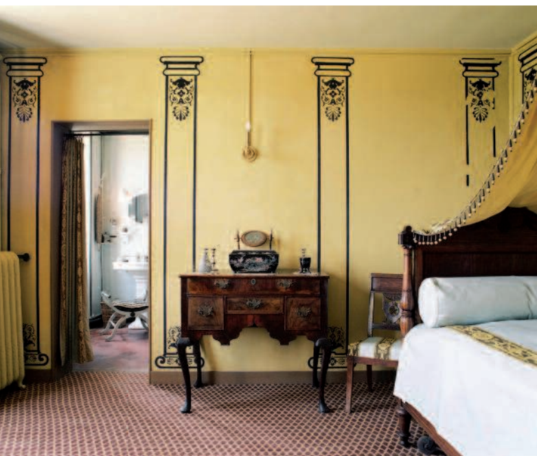
La chambre dans la Maison Maurice Ravel, le Belvédère à Montfort l'Amaury (78)

À travers quelques exemples de maisons de personnages célèbres, l'auteur met en lumière les contraintes posées par l'ouverture aux publics de ces lieux d'intimité, montrant les difficultés du travail du muséographe qui doit trouver un juste milieu entre une approche purement architecturale et une approche globalement muséographique ainsi qu'un équilibre entre l'interprétation et la conservation in situ, garante d'une certaine authenticité.