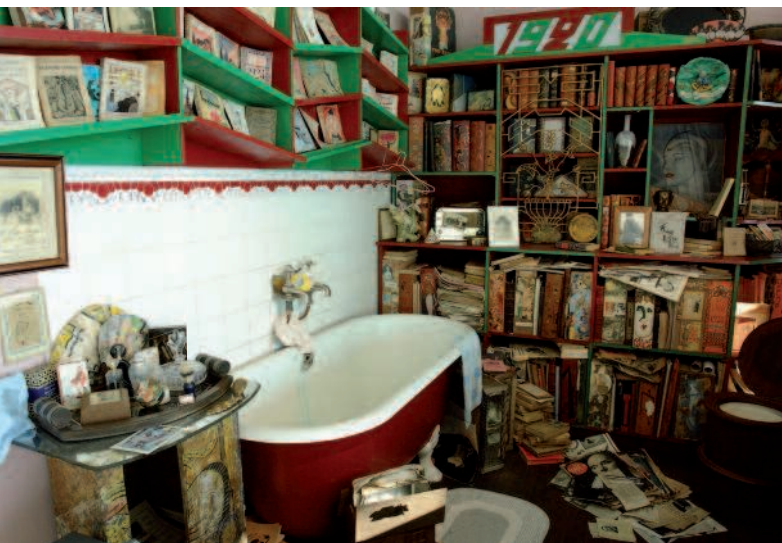
Aperçu de la salle de bains. Musée Henri Pollès-Bibliothèque des Champs Libres (Rennes)

Un travail de reconstitution a ainsi été mené pour réinstaller les pièces de vie de la maison de l'écrivain Henri Pollès dans un espace dédié au sein de la bibliothèque des Champs Libres à Rennes. Aucun visiteur n'imagine, un seul instant, pénétrer dans la maison de l'écrivain. Grands parallélépipèdes ouverts et offerts à la manière de croquis en éclaté, ce choix accompagne la volonté de l'écrivain-collectionneur de créer un musée des « livres et des lettres ». L'intérieur de l'écrivain préfigurait déjà le musée. Le musée Pollès valorise l'idée de musée-maison.