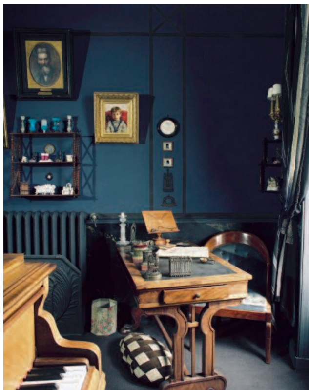
Le salon de musique de la Maison Maurice Ravel

Pour toutes ces questions, le contrat moral engagé entre le muséographe et le lieu est aussi un contrat avec le visiteur. Ce contrat est donc, en réalité, tripartite. Au-delà d'un simple accompagnement, le muséographe s'engage à préserver l'attente d'équilibre entre étrangeté et réponses à des questions simples. Pour ce faire, l'élaboration de la visite, pièce par pièce, relève du muséographiquement « cousu-main ». Certaines pièces projettent plus que d'autres dans les univers de création, comme par exemple, le salon de musique de Maurice Ravel.