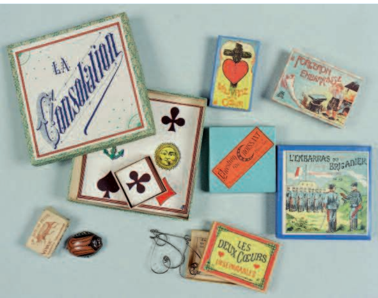
La collection des boîtes de Maurice Ravel. Maison Maurice Ravel, le Belvédère à Monfort l'Amaury (78)

La question de l'ouverture des fenêtres à la belle saison qui s'impose pour des raisons d'aération et qui entraîne à la longue des décolorations localisées notamment au niveau des papiers peints, a été elle aussi intégrée à la visite puisque c'est la médiatrice-guide qui gère progressivement ces ouvertures selon un rythme précis tout en rabattant les volets. Ce geste simple apporte à la visite un caractère vivant et intime tout en laissant entrevoir le jardin. La visite se fait au rythme d'une partition de gestes associant conservation et vie de la maison. Le parti pris muséographique prend ici le pli d'une minutieuse mécanique chorégraphique, avec sa grammaire et son vocabulaire propres. L'écriture du scénario de visite révèle une conversation à huis clos, un tissage de « mots-gestes-regards » accrochés aux indices et objets. Laissant place à une marge d'improvisation, le scénario oscille entre des temps encadrés et des moments d'échanges libres, presque improvisés. La progression de pièce en pièce s'appuie sur une écriture serrée et doublée d'une pratique de mise en espace. Par le jeu de la superposition de la parole et du geste et l'intrusion du lieu comme espace scénique partagé par le petit groupe, la découverte investit le champ de l'immédiateté et de la complicité.