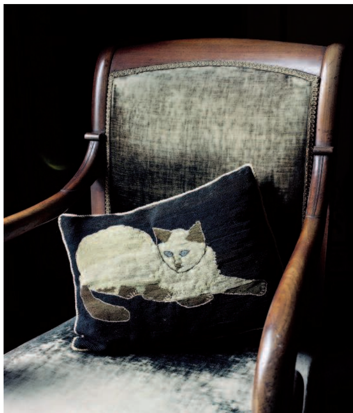
Dans la Maison Maurice Ravel, la présence du coussin au chat recrée une présence.

La posture déambulatoire rend ainsi physiquement accessible le décor, l'œuvre et le personnage. Concevoir la visite au travers d'un synopsis du déplacement évite la passivité du visiteur. Ajouter les mots à la promenade, c'est ensuite recréer un jeu de regards croisés entre les objets et l'ensemble mis en perspective de la vie d'un homme. Le retour permanent à la matérialité et ce qu'il en reste prend alors la forme d'une conversation infinie entre la maison et ses hôtes. Le caractère spécifique de la visite d'un lieu littéraire repose sur cette relation unique du visiteur avec le lieu.