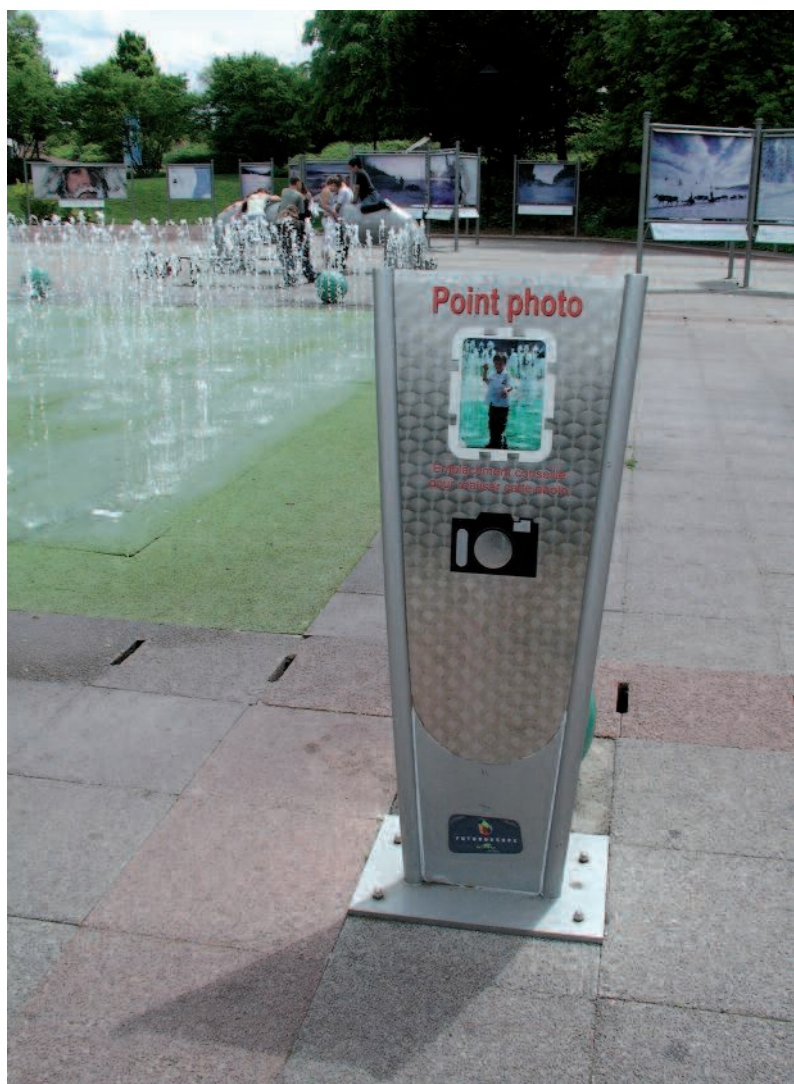
Parfois l'établissement (ici le Futuroscope) indique aux visiteurs le meilleur angle de prise de vue.

On pourrait aussi regretter que l'on confonde généralement dans l'interdiction de photographier la prise de vue des œuvres et celle de leur contexte. Même si cela est anecdotique, les muséologues sont souvent énervés de ne pouvoir photographier la mise en exposition sous prétexte du droit des œuvres.