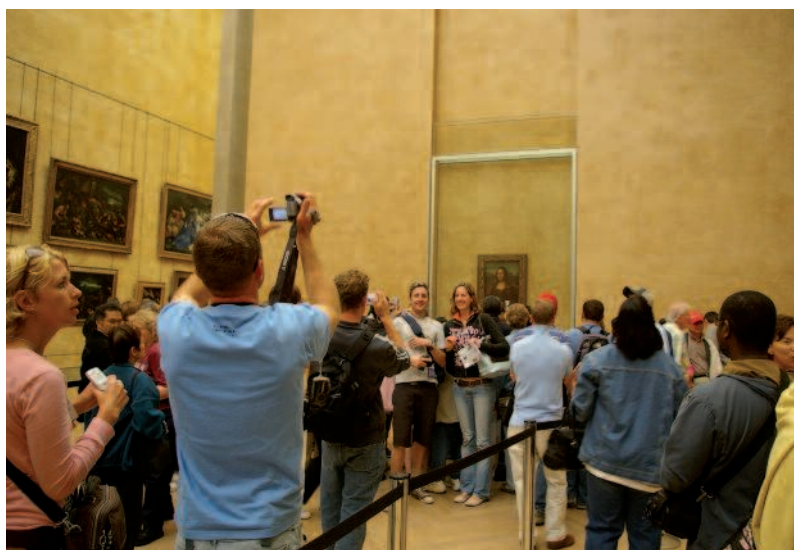
Prolonger la visite...

L'interdiction totale de la photographie appliquée par des institutions de plus en plus nombreuses est pourtant difficile à mettre en œuvre. Elle provoque des situations de lutte incessante entre les agents de surveillance, à qui cette consigne est donnée, et le