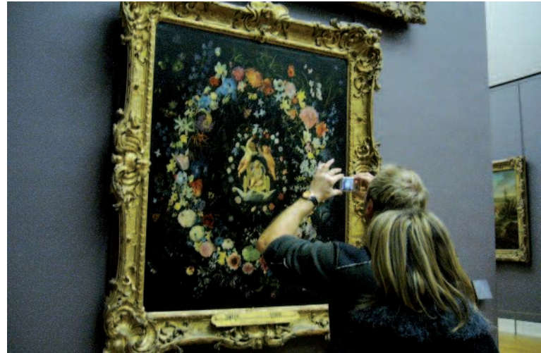
Garder un souvenir...

public. Soit le gardien finit par « fermer les yeux » ou détourner son attention pour éviter le conflit, soit il passe son temps à faire une chasse aussi vaine qu'inutile. Certains surveillants prennent un malin plaisir à montrer ainsi leur autorité, menaçant de confisquer appareil ou pellicule envers un photographe récidiviste, comme on gronde un enfant fautif. Le visiteur se transformant en mauvais élève à surveiller. Sans doute est-ce là un effet pervers d'un métier peu valorisant, mais qui l'est d'autant moins qu'on l'oriente vers des fonctions purement disciplinaires et coercitives. L'invitation à être des instruments de police davantage que des aides aux visiteurs peut impulser un climat détestable dans l'institution. Il y a bien sûr d'autres interdits à faire respecter dans un musée, mais celui de photographe, quand c'est le cas, joue un rôle récurrent et vite obsédant. La disjonction entre le rôle attribué au gardien et son intérêt réel est d'autant plus flagrant.