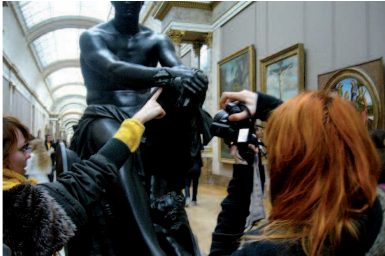
Personnaliser la visite...