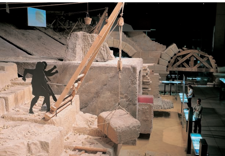
Sur le site du Pont du Gard, l'exposition permanente met en scène des reconstitutions du chantier de construction de l'aqueduc romain.