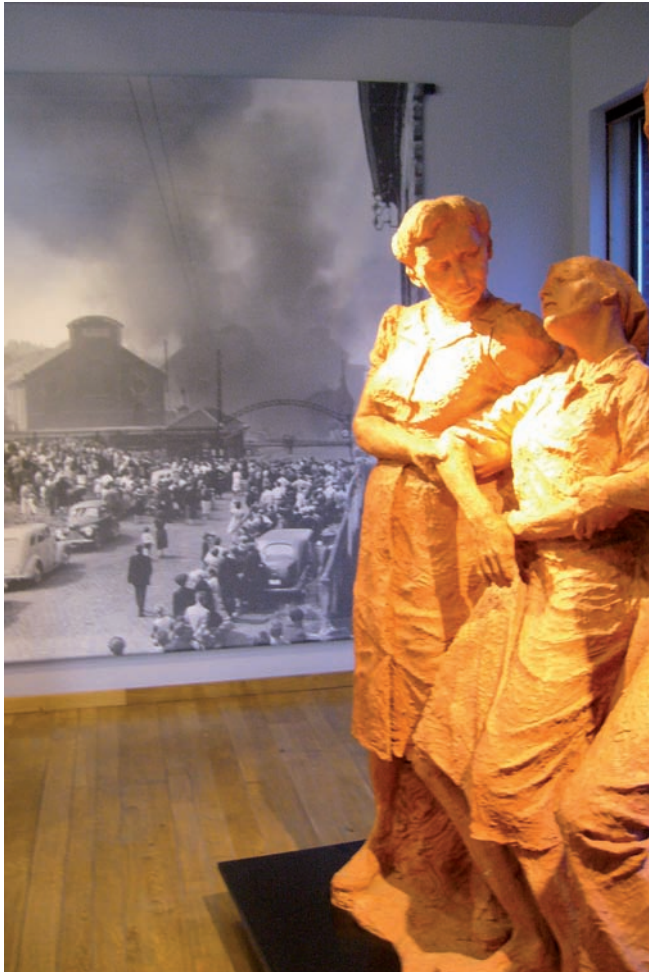
Le Bois du Cazier, à Marcinelle en Belgique, présente un panorama de l'histoire industrielle de la Wallonie. Il est d'abord un émouvant lieu de mémoire de la catastrophe minière du 8 août 1956.

est apparu et s'est développé dans les musées comme nécessité d'accompagnement et d'explicitation du discours, cela a été contemporain d'une juste revendication, portée haut en son temps par la nouvelle muséologie, de réhabiliter les autres dimensions de l'expérience sensible. L'émotion, mais aussi les sens dans toute leur ampleur, l'expérience du visiteur, et la prise en compte des affects. L'exposition s'est donc diversifiée en intégrant les sons, les odeurs, les sensations tactiles, les effets visuels, et le lieu a développé son attention au ressenti et à l'appropriation par les usagers, notamment dans ses techniques de médiation. C'est en cela que Tilden, dès les années 1960, a été un précurseur en formalisant quelque chose qui depuis se déploie dans le monde des musées. Le centre d'interprétation cons- titue, d'une certaine façon, un idéal-type du renouvellement des formes qui concerne toutes les expositions, quels que soient les lieux où elles se tiennent. Musées et centres d'interprétation évoluent de concert.