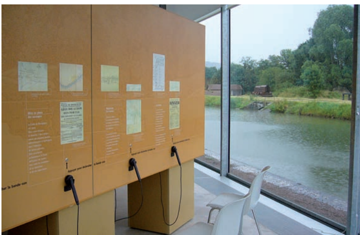
Le centre d'interprétation de Pouilly-en-Auxois est consacré au canal de Bourgogne sous ses aspects historique, économique et technique.

La seconde dimension, déjà proposée assez logiquement dans l'ouvrage de Tilden et qui sans conteste a fait florès, est le recours privilégié à l'émotion (par opposition au musée soupçonné – voire accusé – de préférer l'information, la raison ou la science). Si donc tout équipement patrimonial a bien pour finalité de contribuer au partage par un large public des valeurs symboliques et culturelles représentées par le patrimoine, c'est la méthode mobilisée par les conservateurs qui avant tout diffèrerait. Par nature, le patrimoine, en effet n'est accompli que dans la mesure où sa valeur est ressentie, comprise et transmise de génération en génération.