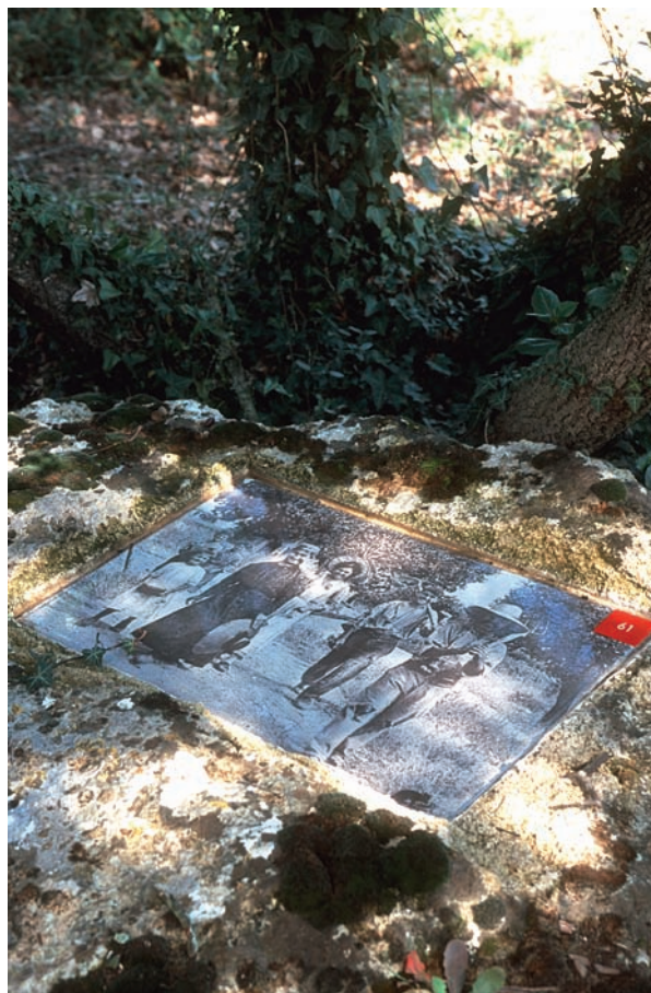
L'histoire du paysage méditerranéen du Pont du Gard est mis en valeur à travers le sentier Mémoires de garrigue : des piges d'arpenteurs balisent le parcours et guident les visiteurs tandis que les documents intégrés aux pierres évoquent les hommes qui ont façonné ce paysage.