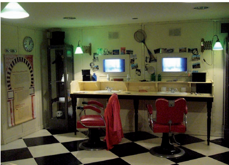
À Saint-Nazaire, le centre Escale Atlantique propose des reconstitutions (ici le salon de coiffure d'un paquebot) qui plongent les visiteurs dans l'univers des grandes traversées transatlantiques d'autrefois.

qu'ils guident et accompagnent ; la médiation programmée et concrétisée par des moyens permanents, disséminés sur le site ou réunis dans un équipement spécialisé (médiation proactive) que les visiteurs utiliseront à leur guise et de façon autonome.