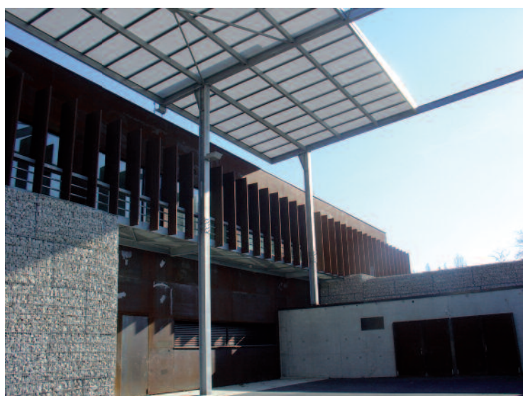
Le Centre de Conservation et d'Étude de Lons-Le-Saunier et ses trois matériaux : gabions en pierre, acier et auvent en polycarbonate

L'installation du Centre de Conservation et d'Étude de Lons-Le-Saunier, en décembre 2009, a été l'occasion d'une prise en compte simultanée des objectifs de conservation préventive des œuvres et de développement durable dans un projet muséal : elle a permis de considérer différemment la définition d'un programme architectural, tant dans la construction d'un bâtiment que dans son fonctionnement.