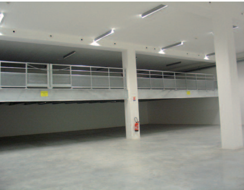
L'intérieur d'une réserve : un entresol a été posé pour réaménager les collections en cas d'extension.