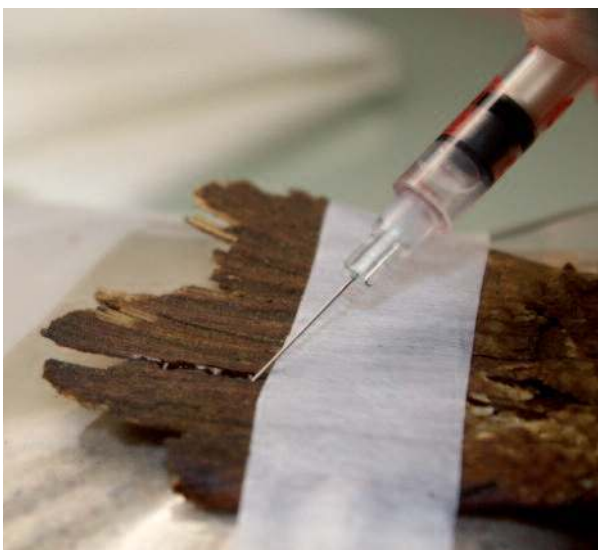
Infiltration à la seringue, à la jonction des deux parties de la nageoire caudale du spécimen Lates niloticus N° B-3068

Paraloïd B72 à 20 %, qui a fait ses preuves dans le collage des os. Cette opération est intéressante à plusieurs titres :