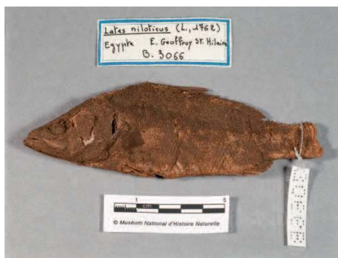
État avant restauration du spécimen Lates niloticus N° B-3066 côté gauche

Parmi plusieurs solvants sélectionnés selon certains critères – volatilité élevée, tension superficielle (Ts) faible – l'acétone a donné de bons résultats au test sur du NaCl et a donc été choisie comme diluant des résines.