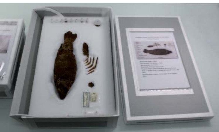
Boîte de stockage d'un des spécimens Lates niloticus étudié.

Cette étude de cas de deux poissons momifiés égyptiens, dont l'état critique de conservation nécessitait une intervention de conservation-restauration afin de leur redonner une certaine lisibilité, a été l'occasion de s'interroger sur les choix à opérer, sur les limites de l'intervention et sur la légitimité à privilégier la pérennité sur la réversibilité.