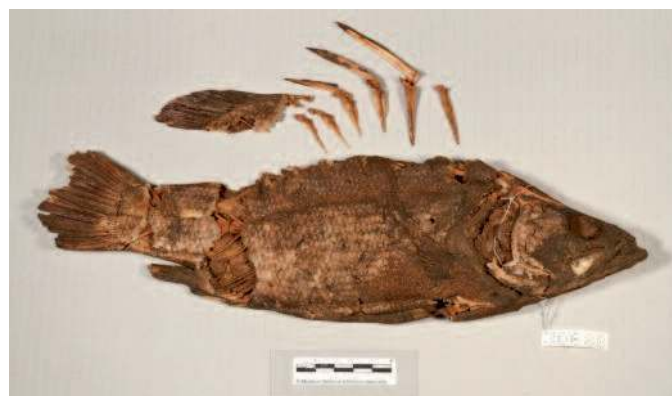
Les côtés gauche et droit du spécimen Lates niloticus N° B-3068 après restauration