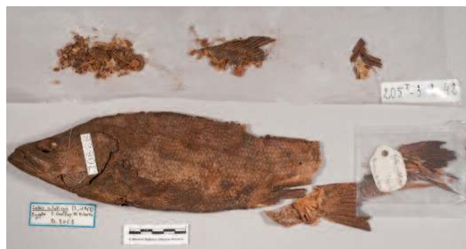
État avant restauration du spécimen Lates niloticus N° B-3068 côté gauche

Concernant les procédés égyptiens de momification des poissons, la littérature (3) mentionne l'utilisation de Natron (NaCl, CaCO 3 , CaSO 4 ) riche en substances salines. Des analyses et des tests (nitrate d'argent) (4) réalisés sur des échantillons de surface des poissons étudiés attestent la présence de l'élément Chlorure. Pour cette raison, il était primordial que le diluant des résines à tester n'interfère pas avec ce dernier, constituant des produits de momification.