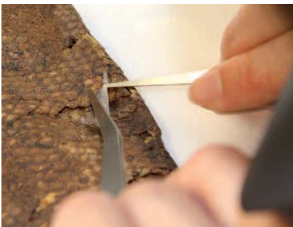
Insertion de papier Japon sous soulèvement du spécimen Lates niloticus N° B-3068

L'Elvacite 2046 (résine acrylique) concentré à 20 % dans l'acétone a été choisi comme consolidant et à 30 % dans l'acétone comme adhésif. La consolidation des soulèvements et de certaines fissures s'est fait par doublage au papier Japon Tengujo (6 g/m 2 ) couplé à l'adhésif à 30 % dans l'acétone (appliqué à la seringue) mais également par infiltration, à la seringue, sous les écailles. Le collage des parties désolidarisées s'est fait par infiltration d'Elvacite 2046 à 20 % à la jonction des parties remises en connexion (nageoires dorsale et caudale). Les quatre vertèbres désolidarisées ont pu, quant à elles, être collées ensemble par couplage de papier Japon imbibé d'acétone puis adjonction, à la seringue, de