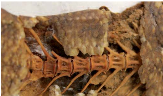
Vertèbres du spécimen Lates niloticus N° B-3068 après collage à la colonne vertébrale et à la plaque hypurale

Les deux momies ont fait l'objet d'une intervention limitée mais ciblée. Même si la réversibilité est une constante recherchée en conservation-restauration dans l'absolu, elle n'est pas toujours possible réellement. C'est un subtil mélange entre la théorie et la pratique.