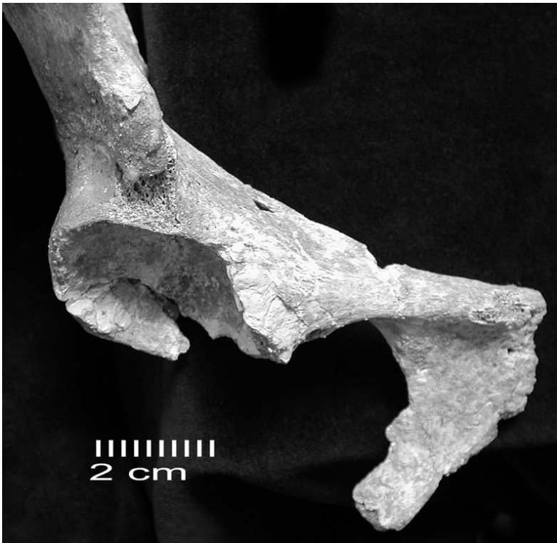
Fig. 5 - Saint-Germain-la-Rivière skeleton : Right coxal bone frontal view of the pubis part