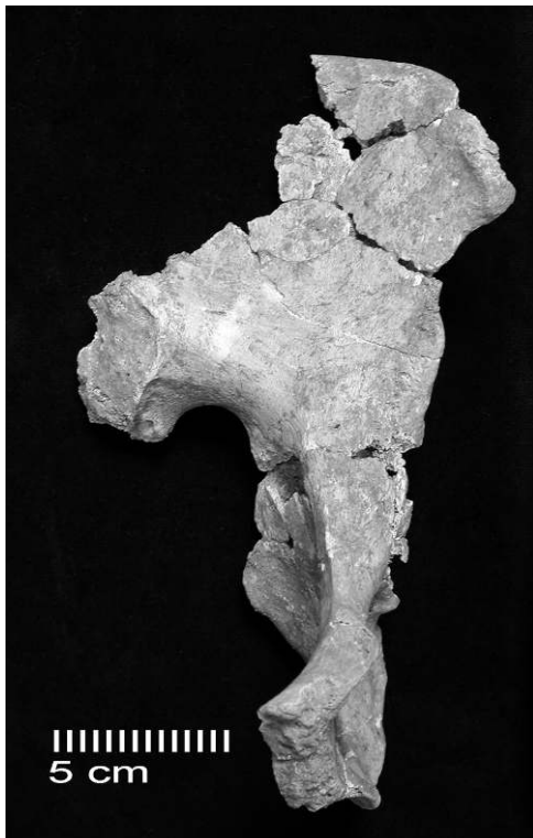
Fig. 4 - Squelette de Saint-Germain-la-Rivière : Vue médiale de l'os coxal gauche Fig. 4 - Saint-Germain-la-Rivière skeleton : Medial view of the left coxal bone