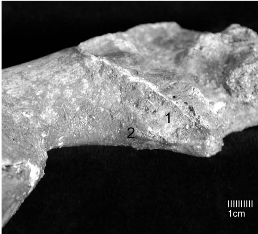
Fig. 6 - Saint-Germain-la-Rivière skeleton : Preauricular surface of the right coxal bone. (1) depression ; (2) tubercle