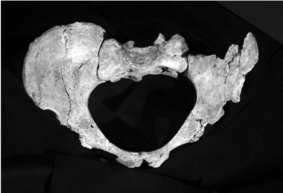
Fig. 1 - Squelette de Saint-Germain-la-Rivière : Vue supérieure du bassin Fig. 1 - Saint-Germain-la-Rivière skeleton: Superior view of the hip bone