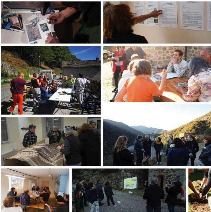
Figure 1. Diversité des actions menées par le collectif à Sainte-Marguerite-Lafigère avec la population

Source : Jeux de terrain, mai et février 2019.