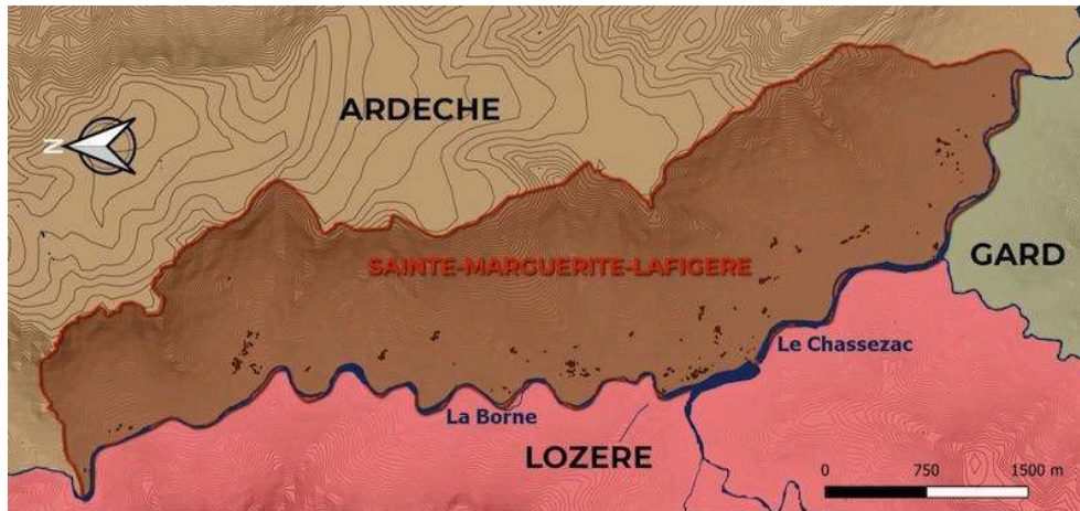
Figure 2. Carte de situation de Sainte-Marguerite-Lafigère