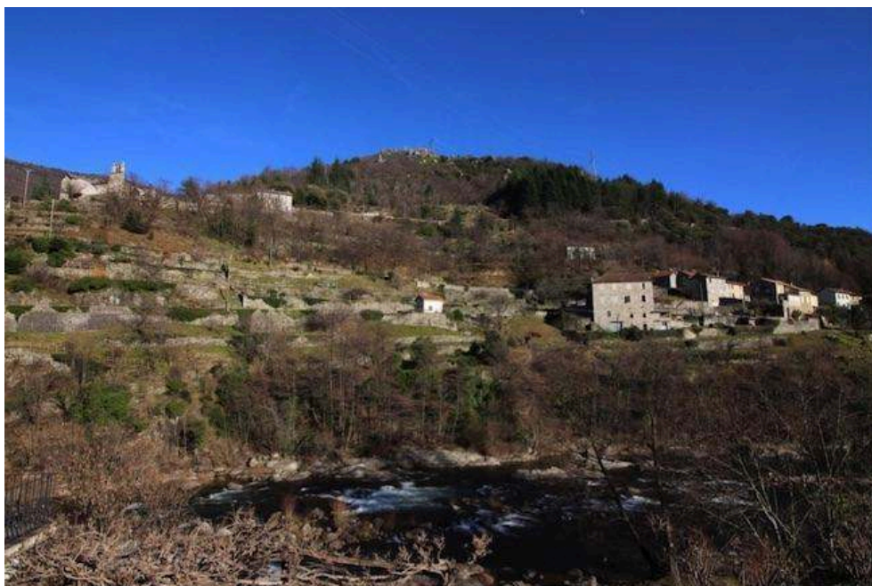
Figure 3. Sainte-Marguerite-Lafigère

Vue du hameau de Cordes et de la rivière Chassezac depuis la rive lozérienne.