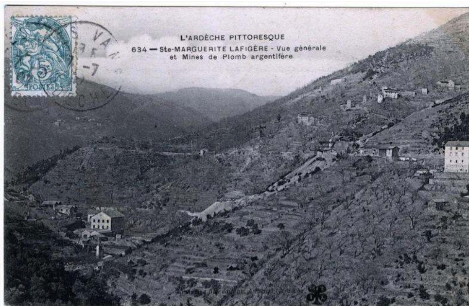
Figure 5. Vue du paysage de la vallée au début du XX e siècle autour des mines de la Rouvière marqué par le faible boisement et une agriculture en terrasses