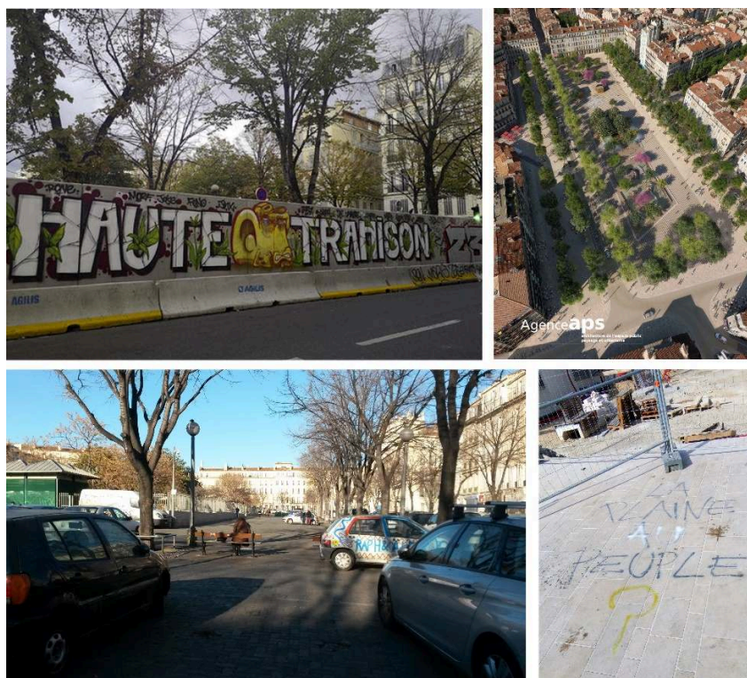
Figure 6. La place Jean-Jaurès à Marseille

De gauche à droite et de haut en bas : vue de la place avant-projet le 8 janvier 2017 ; vue aérienne du projet de l'agence APS ; vue du mur installé pendant le chantier autour de la place par la maîtrise d'ouvrage ; vue sur une inscription au sol pendant le chantier et la journée de terrain.