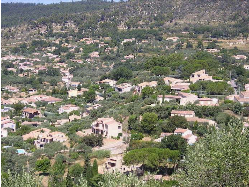
Figure 2. Les olivettes conservées dans la périphérie de Manosque (Alpes-de-Haute-Provence)

beaucoup, toujours entretenus : ils sont taillés régulièrement, la plupart des arbres sont soignés avec de la bouillie bordelaise contre la fumagine, les olives sont récoltées et amenées à la coopérative oléicole voisine.