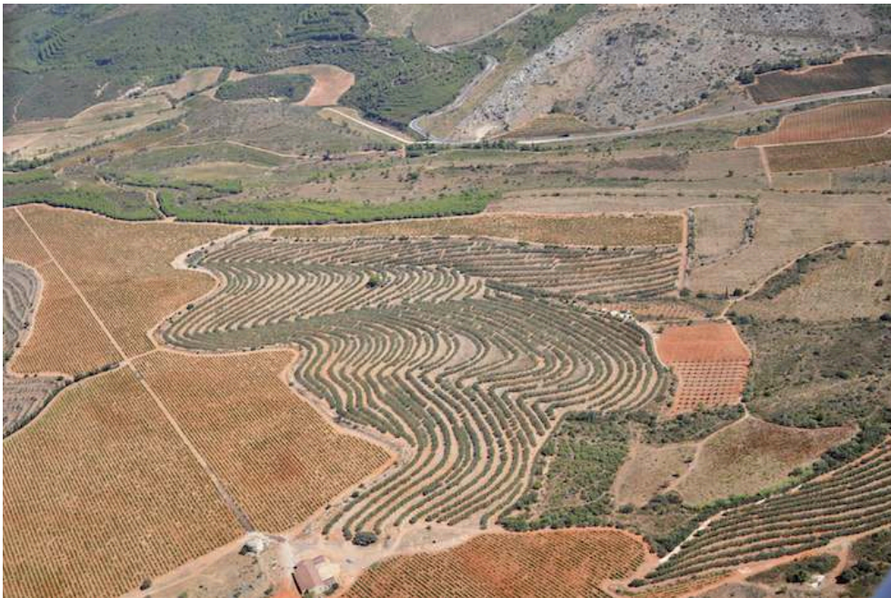
Figure 5. Nouvelles oliveraies intensives à Salses-le-Château (Pyrénées-Orientales)

Au centre de ce cliché, on voit les oliviers serrés en lignes continues formant de véritables haies fruitières irriguées par goutte-à-goutte ; la densité de ce verger moderne atteint au moins 800 oliviers/ha. Les oliviers sont taillés par des engins mécaniques qui passent entre les rangs et qui cisailent tous les rameaux dépassant une forme prédéfinie. Les olives sont, quant à elles, récoltées avec des machines à vendanger ou des vibreurs de troncs dotés de réceptacles articulés.