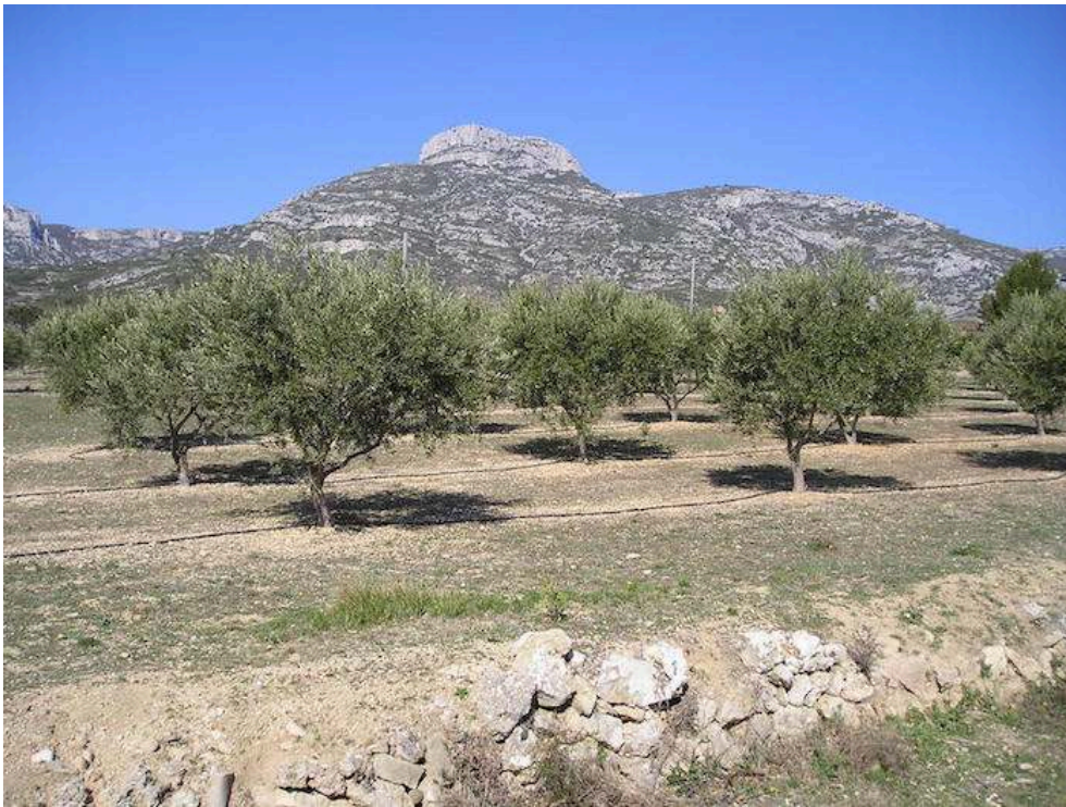
Figure 4. Jeune plantation d'oliviers chez un oléiculteur amateur à Aubagne (Bouches-du-Rhône)