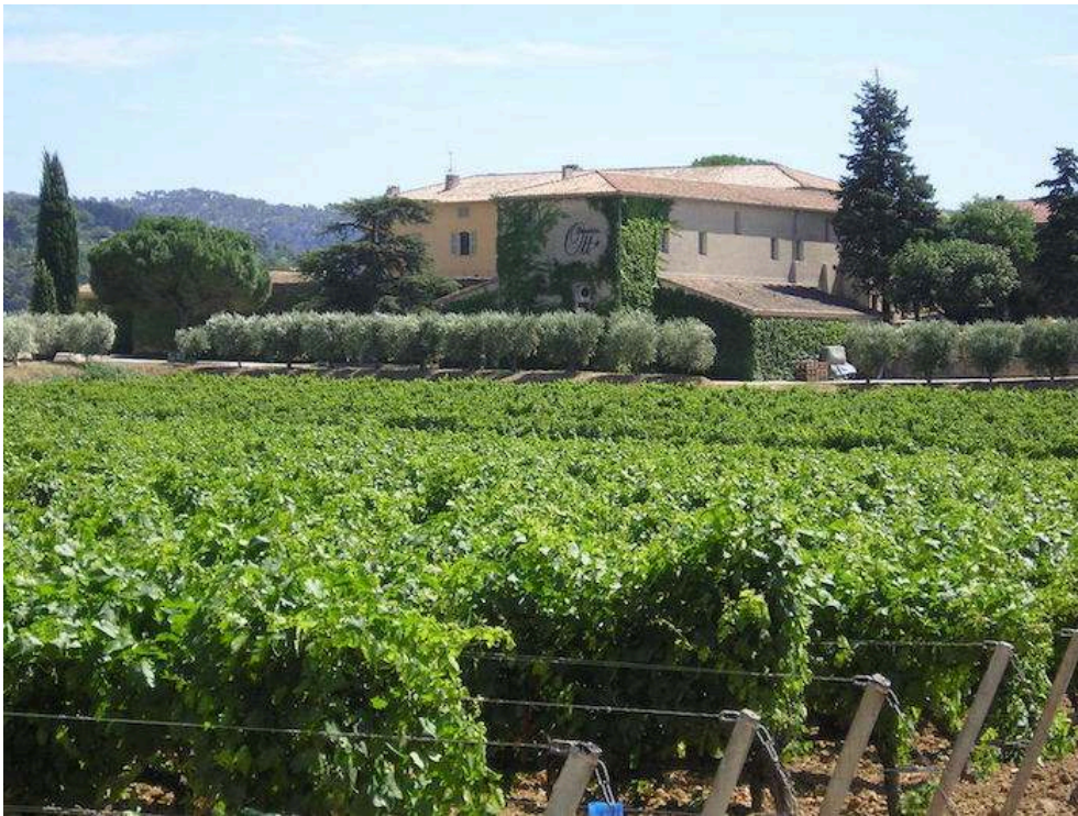
Figure 7. Le domaine viticole Ott ceinturé par une allée d'oliviers au Castellet (Var)