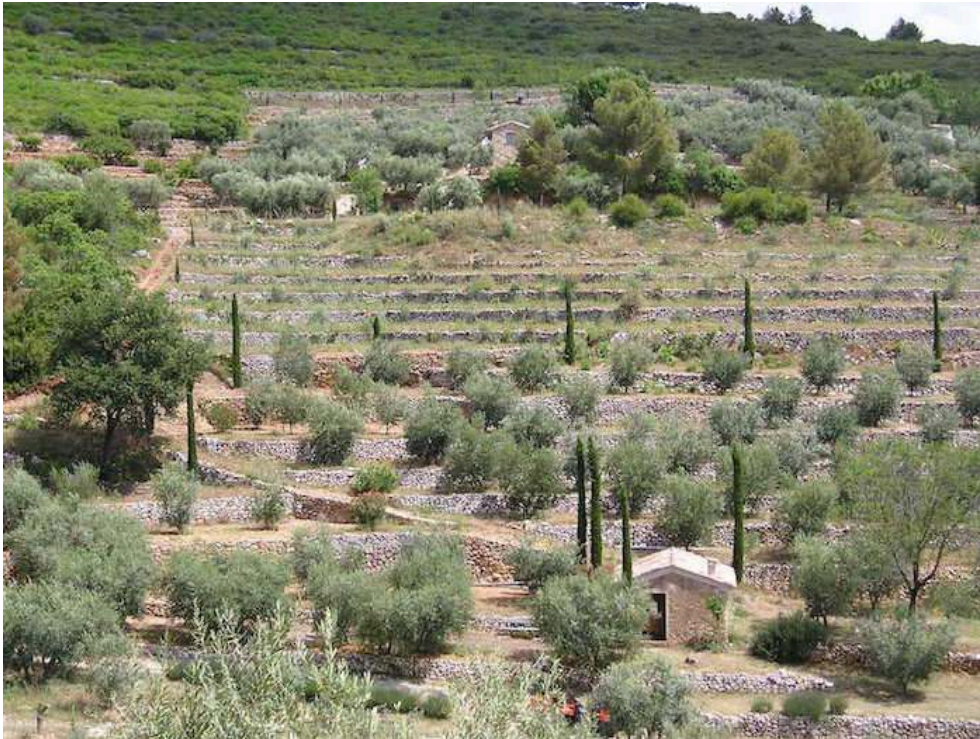
Figure 6. Terrasses et oliveraies réhabilitées par un particulier à Roquevaire (Bouches-du-Rhône)

important de rappeler la place importante du bâti agricole et en particulier des terrasses dont la valeur patrimoniale est reconnue depuis les années 1980 (Ambroise et al. , 1989 ; Toubanc, 1990). Les terrasses couvertes d'oliviers font ainsi l'objet d'opérations de réhabilitation portées par des collectivités territoriales (par exemple le conseil départemental de la Drôme pour le site de Villeperdrix), par des associations (comme Les Terrasses de Gellone à Saint-Guilhem-le-Désert ou Li Bancau d'oliveto à Lurs) ou par des particuliers comme au Grand Vallon à Roquevaire (figure 6).