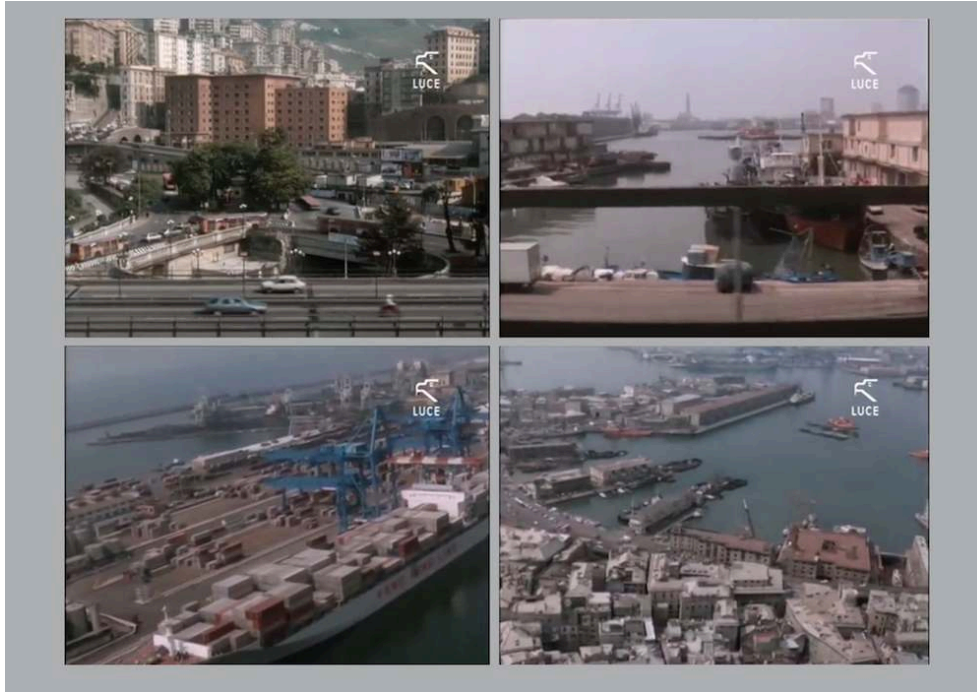
Planche 3. Photogrammes du film Genova d'Alberto Lattuada (1989).

Comme les viaducs autoroutiers qui la traversent, les vastes infrastructures portuaires de Gênes sont des éléments caractéristiques du paysage de cette grande ville industrielle.