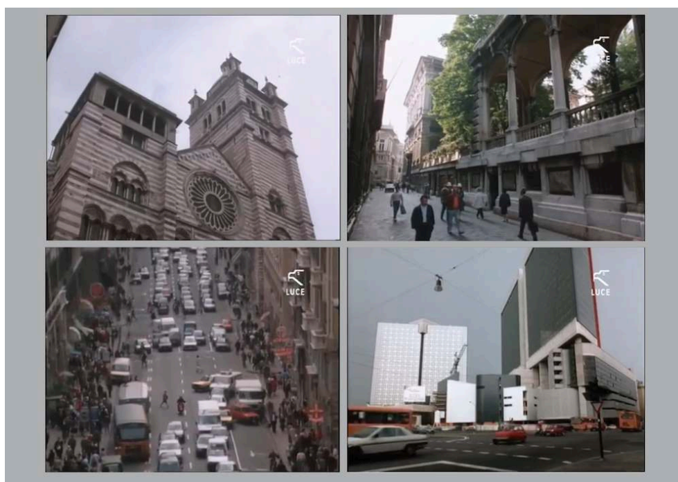
Planche 2. Photogrammes du film Genova d'Alberto Lattuada (1989).

Le film fait apparaître différentes strates historiques de la ville, ainsi que certains aspects de sa vie quotidienne : le trafic automobile, les passants, l'animation des rues.