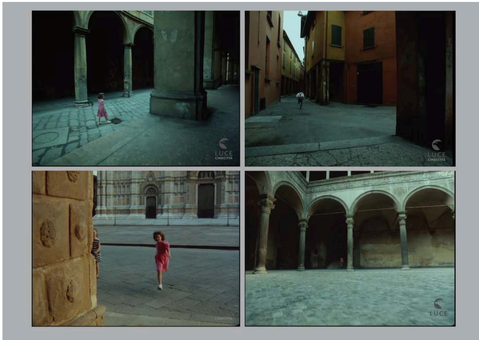
Planche 5. Photogrammes du film Bologna de Bernardo et Giuseppe Bertolucci (1989).

La séquence, très composée, place le regard des spectateurs à la hauteur de celui des enfants, et adopte le rythme de leurs déplacements et de leurs jeux dans les rues du centre historique.