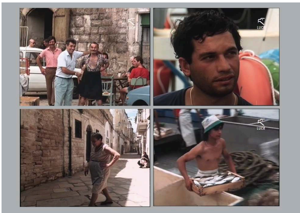
Planche 4. Photogrammes du film Bari de Lina Wertmüller (1989).

Le montage rapide de cette séquence accorde une place importante aux visages et aux mouvements quotidiens des citadins. Bari montre une ville habitée, faisant varier les focales, les cadrages et les angles de vue.