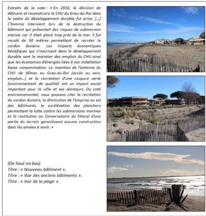
Figure 4. Photographies de la série : « CHU du Grau-du-Roi », collège d'Alzon, Vestric-et-Candiac (30)

thématique imposée du paysage, les « différentes problématiques de développement durable ».