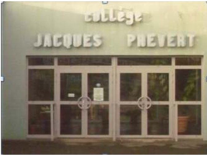
Figure 5. Photographie extraite de la série : « Prises de vue à l'ancienne », Carte postale d'antan , collègue Jacques Prévert, Herbignac (44)