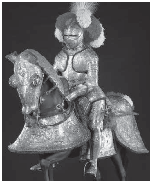
5. Eliseus Libaerts et atelier anversoïsois, « armure d'Hercule » et barde équestre d'Erik XIV de Suède, 1563, Dresde, Staatliche Kunstsammlungen, Rüstkammer.

Quelque dix ans avant la série d'articles de Thomas, la question de la paternité et des lieux de création de ces armures « dans le goût français » avait été rendu encore plus complexe par la publication en 1945, sous la plume des érudits suédois Cederström et Steneberg 12 , d'une étude consacrée à l'écu en cartouche du château de Skokloster. Ils comparèrent le décor de cette pièce prestigieuse à celui d'une armure alors conservée au sein des collections du Livrustkammaren à Stockholm et mentionnée dans les comptes des dépenses du roi de Suède Erik XIV en 1562 (fig. 5). Ces archives inédites ont révélé que le souverain avait commandé trois armures et trois bardes de cheval dont la livraison s'était avérée problématique : après avoir reçu en 1562, soit un an après son avènement, une première armure, le monarque avait demandé à son fournisseur l'exécution de deux armures supplémentaires et d'une somptueuse barde équestre, dans la perspective d'une union avec Elisabeth I re d'Angleterre dont il avait sollicité la main. Embarqués par mer, les deux armures, l'armurier et ses aides furent capturés en septembre 1565 par les Danois, alors en guerre contre les Suédois, et l'artisan dut attendre plusieurs mois avant de revoir sa ville natale 13 . Les deux armures, enfin rendues à leur auteur,