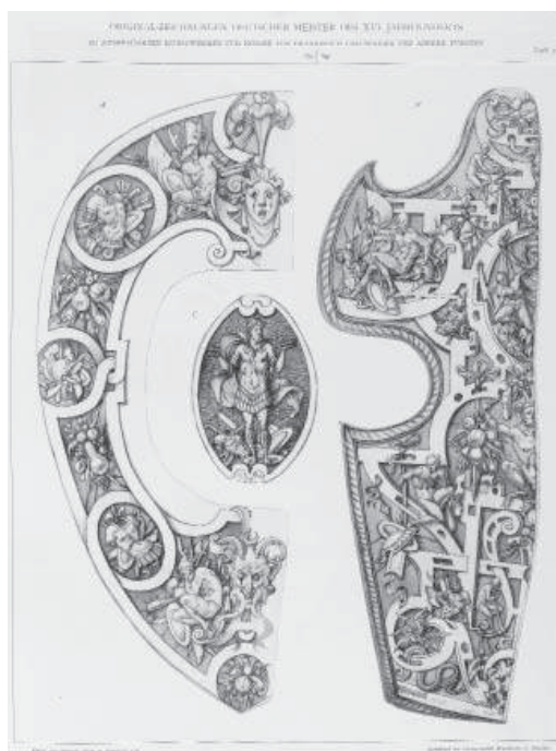
2. Dessins préparatoires attribués à Étienne Delaune (de gauche à droite) : projet pour l'écu d'Henri II, médaillon et variante du chanfrein pour l'armure dite « aux serpents » d'Henri II, [reproduits dans Jakob von Heffnet-Alteneck, Originalzeichnungen deutscher Meister des 16. Jahrhunderts zu ausgeführten Kunstwerken für Könige von Frankreich und Spanien und andere Fürsten , Frankfurt, 1889, pl. 9].

L'esthétique de cet ensemble, dérivée du harnois à décors de cartouches et de cuirs que porte François I er sur le portrait de Jean Clouet mentionnés plus haut, est comparable à celle de l'armure dite d'Henri II du Musée du Louvre, des garnitures de selle et du chanfrein appartenant aux collections du Musée des beaux-arts de Lyon, et de la bourguignotte dite « médicéenne »