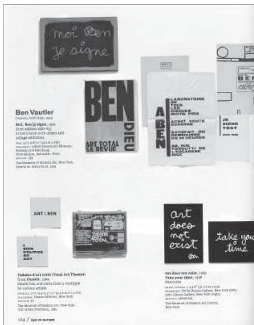
1a. Ben Vautier : Moi, Ben je signe , 1975, New York, MoMA ; Théâtre d'art total , 1964, New York, MoMA ; Art does not exist , 1989 ; Take your time , 1998, New York, MoMA Library ; b. Robert Filliou, The Frozen Exhibition , 1972, Brème, Neues Museum Weserburg ; Optimistic Boxes 1-5 , 1968-1981, New York, MoMA [ Eye on Europe... , 2007, p. 124-125].

À la décharge des commissaires, il faut rappeler que la définition du terme « multiple » est au cœur de nombreuses discussions 3 . De fait, le catalogue, qui rassemble les travaux de cent dix artistes et collectifs issus de vingt pays, propose des reproductions, toutes en couleurs et de qualité, qui donnent à voir la diversité des multiples tant dans les supports – livres, journaux, revues, cartes postales, objets, stickers, papiers peints, flyers, affiches et éphémères – que dans les techniques, notamment dans les techniques d'impression utilisées – gravure, lithographie, sérigraphie, offset, photocopie. Mais ce nivellement est peut-être également un effet de l'exposition qui transforme le statut particulier de certains de ces multiples que sont les livres et les revues d'artistes : d'objets à lire, à manipuler, à feuilleter, ils sont réduits, une fois placés sous vitrines, au statut d'objets à voir.