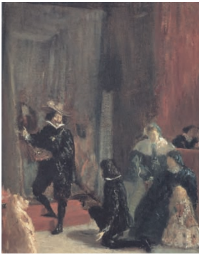
2. Edgar Degas, Variation sur les Ménines de Velázquez , 1857-1858, Munich, Bayerische Staatsgemäldesammlungen [Manet Velázquez. La manière espagnole au XIX e siècle, Paris, 2002, p. 75].