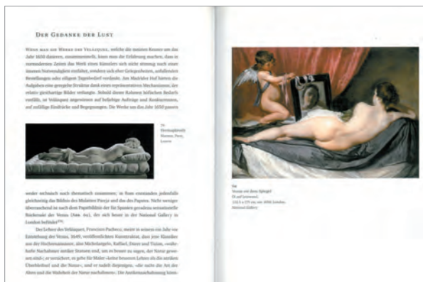
5. Mise en parallèle de l' Hermaphrodite endormi (II e siècle après J.-C., Paris, Musée du Louvre) et de la Vénus au miroir de Diego Velázquez (vers 1650, Londres, The National Gallery) [Martin Warnke, Velázquez: Form & Reform , Cologne, 2005, 134-135].

et aux deux dernières décennies de sa vie. Pour ce qui est des peintures sévillanes, le travail de Tanya Tiffany a permis de révéler leurs liens avec la littérature de dévotion contemporaine 13 , et je pense qu'elles peuvent être mises en rapport avec le discours de la théorie de l'art sur le paragone . Parmi les nouvelles pistes de recherche fécondes, il y aurait sans doute lieu de confronter l'œuvre de Velázquez avec d'autres médias, en particulier la littérature et la sculpture (fig. 5). Dans mon ouvrage, par exemple, j'ai interprété Les Fileuses et Les Ménines en lien avec la notion d' agudeza , soit la finesse, l'acuité, chez Baltasar Gracián 14 . Il ne fait aucun doute que ces tableaux, comme La Vénus au miroir (1647-1651, Londres, The National Gallery), continueront de susciter d'autres interprétations et ne seront jamais à proprement parler « résolus ». Ils résonnent avec d'autres œuvres d'art tout en étant très différents.