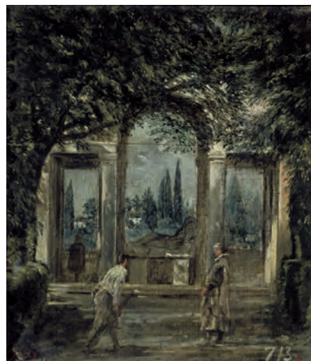
4. Diego Velázquez, Vue du jardin de la Villa Médicis , vers 1630, Madrid, Museo Nacional del Prado.

Giles Knox. Les travaux de recherche sur Velázquez ont permis ces dernières décennies de définir plus précisément la chronologie de sa carrière, les limites de son œuvre, et son degré d'implication dans des activités autres que la peinture à la cour de Philippe IV. Certaines questions restent toutefois en suspens en matière de chronologie, en particulier quant à la période sévillane et aux dernières décennies de sa vie. Velázquez a produit si peu d'œuvres à la fin de sa carrière qu'il est impossible de restituer une évolution stylistique cohérente, et, sauf à découvrir une source de documentation cachée, il est probable que la situation ne changera pas. Pour Séville, les indices sont encore plus rares et les chances de mettre au jour de nouveaux documents bien moindres. Dans le domaine de l'interprétation, les chercheurs ont fait des progrès considérables pour résoudre les mystères des tableaux les plus problématiques, bien que certaines voies se soient révélées des impasses (les emblèmes viennent immédiatement à l'esprit). Quant aux problèmes, ils tiennent là encore essentiellement à la période sévillane