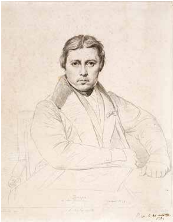
1. Luigi Calamatta, gravure à la roulette d'après un Autoportrait de Jean Auguste Dominique Ingres à la mine de plomb, 1839, Bayonne, musée Bonnat-Helleu.

à désigner toujours davantage des images réalisées par des voies photomécaniques ? La concurrence faite aux graveurs par la photogravure obligeait ces derniers à trouver de nouveaux mots pour défendre leur métier. C'est alors que s'imposa, dans le lexique de la gravure, une expression qui, sans être absente de la littérature artistique au XIX e siècle, était loin d'avoir la préséance sur d'autres formulations : gravure d'interprétation 5 . Certains ont aussi voulu voir le poids du marché de l'art dans l'avènement de cette nouvelle appellation qui aurait servi à conserver leur prestige aux burins de reproduction extrêmement prisés des collectionneurs encore à la Belle Époque, en leur évitant d'être noyés, par confusion nominale, dans le tout-venant des reproductions 6 . Mais la substitution lexicale présentait surtout l'avantage, pour les graveurs, d'entrer en résonance avec les aspirations de l'art moderne en haussant leur travail au rang de libre commentaire – car si toute reproduction, manuelle ou photomécanique, est toujours une traduction (format, support, transfert de la couleur au noir et blanc, etc...), une interprétation signifie autre chose, et renvoie à cette pratique de la libre adaptation, ô combien prisée des avant-gardes, par laquelle un artiste manifeste qu'il n'a rien d'un « servile imitateur ».