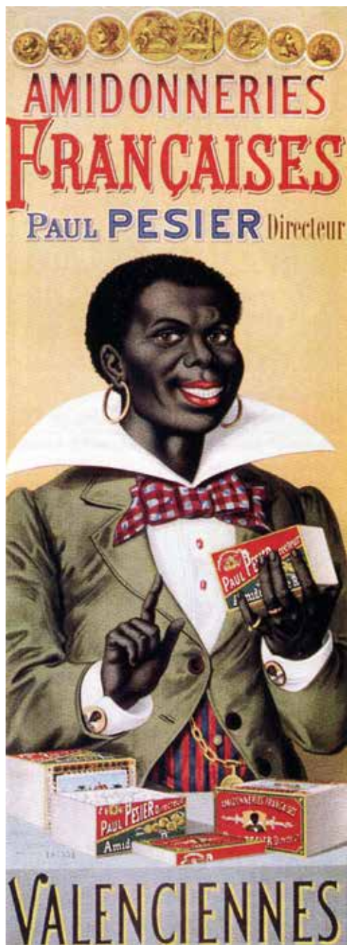
5. Anonyme, Amidonneries Françaises , vers 1890, affiche publicitaire, 82 x 32 cm.

La constellation visuelle de la valorisation unilatérale de la domination blanche par la présence du page noir, reproduite d'innombrables fois depuis l'invention de la formule par Titien, se voit, à la fin du XIX e siècle, transférée au maître colonial, comme le montre par exemple la stratégie publicitaire de la marque allemande de café Kaiserkrone 20 . Cette absence persistante des domestiques noirs, mise en œuvre par les procédés d'anonymisation et de subordination, se poursuit dans l'esthétique marchande. Quelques figures publicitaires s'adressent aussi directement au spectateur, de sorte que les consommateurs (à l'extérieur du tableau) se trouvent mis dans la position de pouvoir des aristocrates blancs et/ou dans celle du maître colonial de l'époque wilhelminienne (fig. 5). Bien que le « portrait d'aristocrate au page noir » ait disparu des Salons à la fin du XVIII e siècle, la pratique iconographique de hiérarchisation et de mise en contraste entre personnes à la peau blanche et à la peau noire ne disparaît donc pas totalement de la culture visuelle européenne. Ce motif entre dans la culture populaire dans le sillage des campagnes européennes antiesclavagistes autour de 1800 et se voit ensuite adapté dans les premières publicités en images vers la fin du XIX e siècle, au point culminant du colonialisme européen.