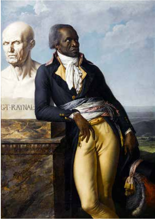
3. Anne-Louis Girodet, Jean-Baptiste Belley , 1797, huile sur toile de lin, 159 × 113 cm, Versailles, châteaux de Versailles et de Trianon.

fortement guidés par des aspirations théoriques ne trouvèrent cependant qu'un faible écho dans la recherche française de l'époque. Au-delà de la barrière de la langue, on peut trouver des raisons à cela dans les différents présupposés théoriques et les divergences entre les cultures de recherche respectives. Ainsi Sylvain Bellenger critique-t-il, en 2005, cette méthode comme étant une manœuvre d'appropriation de la peinture française par les gender studies 6 .