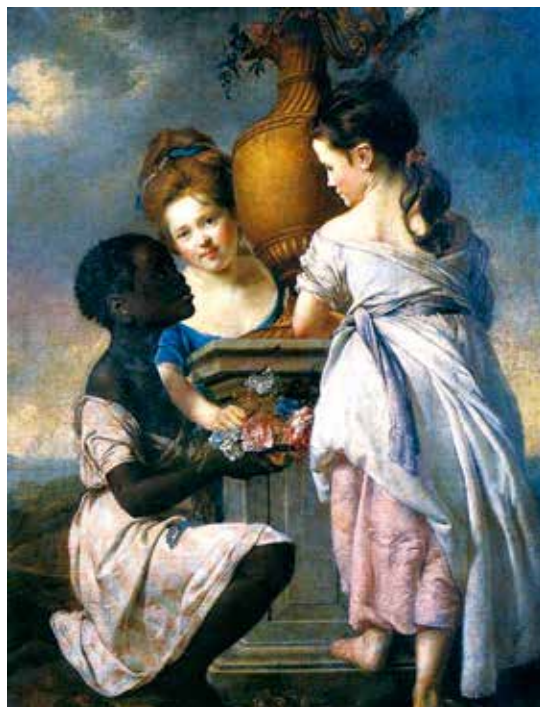
2. Joseph Wright of Derby, A Conversation of Girls [Une Conversation de filles] , 1769, huile sur toile de lin, 127 x 111 cm, collection privée.

Parallèlement à la recherche anglo-américaine, l'histoire de l'art en langue allemande s'est également emparée de ce champ de recherches, sous les auspices de la critique de la représentation. À côté d'historiens de l'art comme Darcy Grimaldo Grigsby, des chercheurs germanophones comme Viktoria Schmidt-Linsenhoff formulèrent une histoire de l'art dans le prolongement des postcolonial et des gender studies 5 . Ces questionnements plus