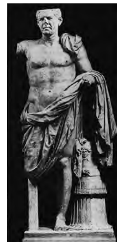
4. Statue colossale en nudité héroïque, dite « Pseudo-Athlète », de la Maison du Diadoumène à Délos, fin II e -début I er siècle av. J.-C., Athènes, Musée archéologique national.