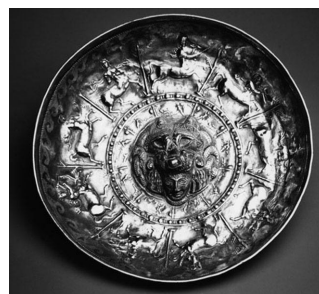
4. Patère de Santisteban del Puerto (Villacarrillo, Prov. Jaén), II e -I er siècles av. J.-C., Madrid, MAN.

On sent bien, à lire et écouter ces travaux 1 , combien le regard s'est déplacé en se préoccupant