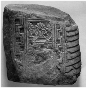
2. Fragment de sculpture de pierre, VI e siècle av. J.-C., Museo de Carmona.

Au-delà de l'appropriation, par les populations indigènes du pays de Tartessos, d'éléments religieux ou de formes architecturales pour des sanctuaires (ainsi celui d'El Carambolo, près de