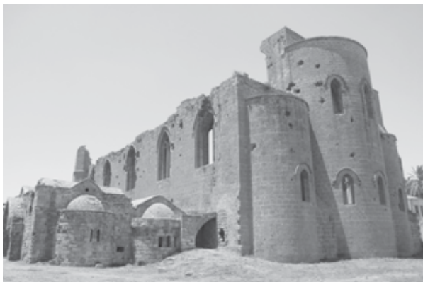
6. Église Saint-Georges-des-Grecs, vers 1360-1370, Famagouste.

« byzantin », mais avec une iconographie clairement franciscaine ou dominicaine, ou en tout cas ancrée dans la tradition de l'Occident latin (fig. 5) 22 . D'une certaine façon, ces bâtiments sont le fruit d'une constellation très spécifique, voire contingente, de protagonistes, mais ils sont aussi le résultat d'un mélange adroit d'éléments étrangers et familiers. Pour prospérer dans la Méditerranée orientale, les ordres mendiants devaient être perçus comme une force nouvelle mais pas totalement autre. La nouveauté de leur message n'était acceptable que si celui-ci revêtait l'apparence de formes familières 23 .