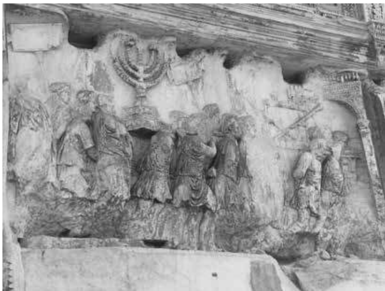
2. Procession triomphale après la destruction et le pillage du temple de Jérusalem figuré sur l'arc de Titus, Rome, 81 après J.-C.

ser à des périodes, des produits, des acteurs ou des centres particuliers. Selon l'intérêt pour le commerce des tissus de soie, des objets faits d'ambre ou des colonnes en marbre du Proconnèse, les itinéraires et les distances de commerce et d'échange diffèrent. Les réseaux du Haut Moyen Âge ne sont pas les mêmes que ceux qui seront actifs après les croisades. Le réseau éminemment personnel du souverain Théodore dans l'Italie des Ostrogoths (493-526) – par ses relations avec Byzance, l'Afrique vandale et les Francs – n'avait rien de comparable au réseau commercial d'une ville marchande de la fin du Moyen Âge comme Venise ou Gênes. Sa raison d'être n'était pas liée au commerce mais aux alliances politiques. Si nous suivons l'odyssée de la menorah du temple de Jérusalem (fig. 2) après la conquête romaine de Jérusalem en 70 de notre ère – de la Palestine à Rome, de Rome à Carthage, de Carthage à Constantinople puis de nouveau à Jérusalem –, cette histoire est davantage liée à la politique et à la guerre qu'à un réseau commercial ou artistique 12 . Même si les conséquences pouvaient être analogues, les objets voyageaient pour des raisons multiples et variées, ce qui se vérifie aussi pour les hommes.