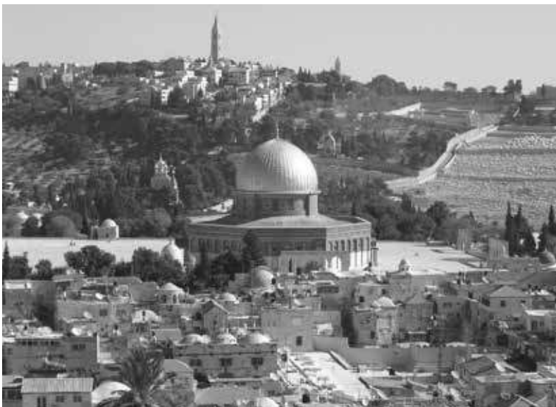
13. Vue du Haram es-Scharif et du mont des Oliviers, Jérusalem.

est sainte pour les trois religions abrahamiques. Appartenant à la terre comme au ciel, elle est porteuse d'une signification historique et religieuse sans pareil depuis plus de trois mille ans. De tout temps, elle a été citée et traduite, reproduite visuellement et reconstruite dans le monde entier, à un rythme et avec une intensité inconnue par les autres villes. En tant que telle, Jérusalem apporte à cette région une dimension universelle (et pas simplement mondiale !), ancrée dans son histoire, dans la Bible et dans le Coran, dans l'autorité de ses lieux saints ( loca sancta ) qui recouvrent la mémoire d'événements exceptionnels (fig. 13). Cet universalisme de Jérusalem repose sur la