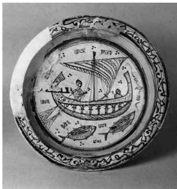
11. Bacino , atelier céramique du Maghreb, XII e siècle, Pise, Museo nazionale di San Matteo.

Michele Bacci. Si la Méditerranée peut être décrite comme un réseau d'échanges inter-culturels, quels sont les centres qui ont joué un rôle fondamental en tant que carrefours artistiques ? Ces sites correspondent-ils invariablement à des centres politiques majeurs, ou bien l'histoire de l'art doit-elle aussi prendre d'autres facteurs en compte ?