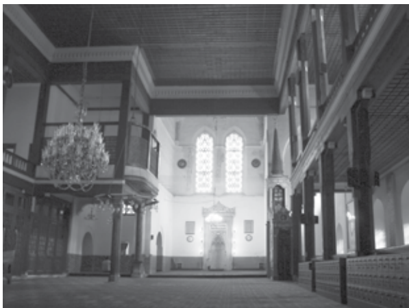
5. Église dominicaine de Constantinople/Pera construite au début du XIV e siècle, aujourd'hui appelée « mosquée des Arabes » (Arap Camii), Istanbul.