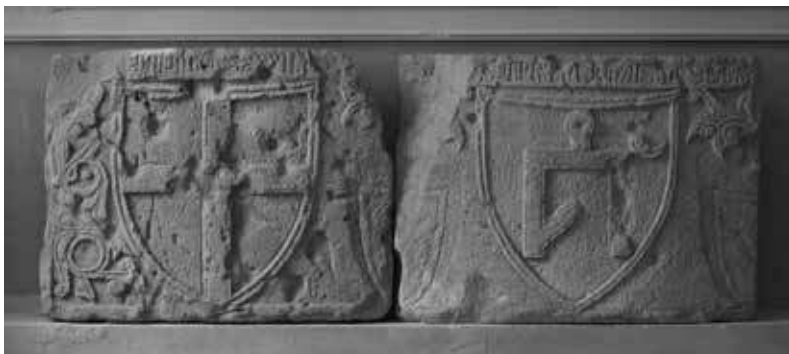
8. Dalles de fondation de la tour Giovanni de Scaffa (1342) avec les armes de Gênes et tamga des Djötchides, Théodosie, Musée des Antiquités de Théodosie.