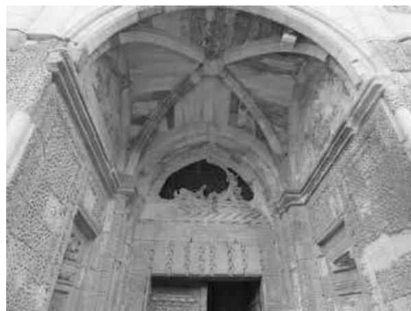
7. Portique oriental de la mosquée Sungurbey, 1335, Niğde (Turquie).

Gerhard Wolf. À côté de l'auto-perception d'un groupe, je placerais la perception par les autres. Il en va de la construction d'une identité et des politiques de l'identité. Tandis que les prémisses traditionnelles de l'histoire de l'art adoptent les autres comme point de départ, il serait important, dans une histoire de l'art méditerranéenne ou transrégionale en général, d'étudier comment ces perspectives se croisent et comment elles suscitent, répandent ou transforment certaines formes, certains symboles déterminés et certaines pratiques esthétiques. Même des œuvres d'art, qui s'établissent d'abord à travers l'auto-perception, participent d'une culture visuelle et intègrent ou combinent des éléments également compréhensibles pour d'autres : elles deviennent donc éloquentes dans un espace au-delà de celui de l'affirmation de soi du groupe.