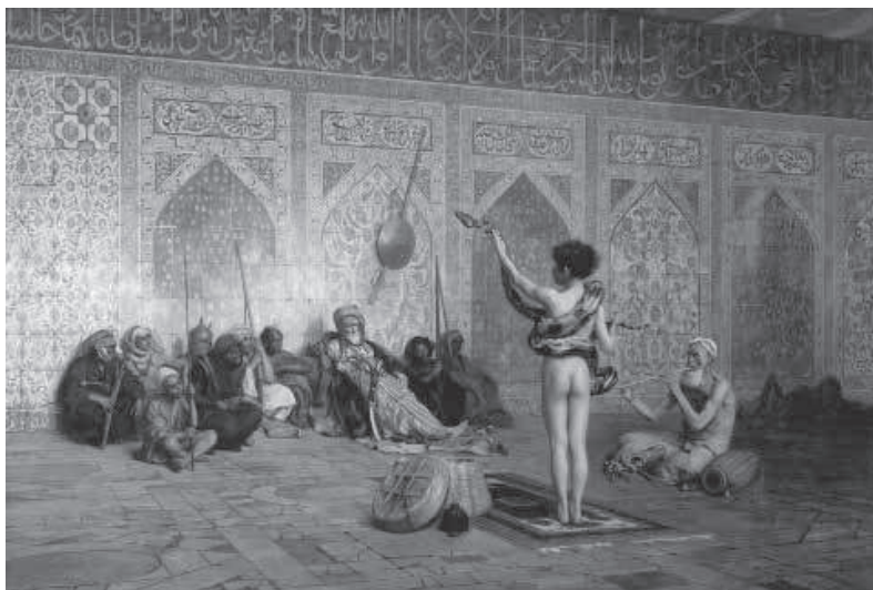
4. Jean-Léon Gérôme, Le charmeur de serpents , vers 1879, Williamstown, Sterling and Francine Clark Art Institute.