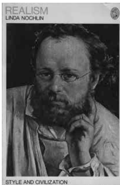
1. Linda Nochlin, Realism , Harmondsworth, 1971.

renouvelée, décapée, indisciplinée, est stimulant et ouvert ; tant il n'a pas de limites temporelles et encore moins spatiales ; tant il révèle ce qu'il y a de plus ambitieux dans une histoire de l'art régénérée.