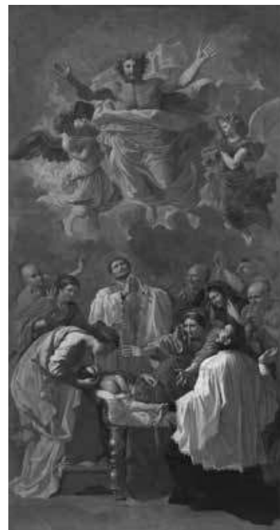
8. Nicolas Poussin, Saint François-Xavier rappelant à la vie la fille d'un habitant de Cangoxima au Japon , 1641, Paris, Musée du Louvre.

Linda Nochlin. Oui, précisément, parce que je crois au fait que la voix, comme vous dites, est une réponse à l'appel de l'œuvre d'art. Dans ce sens je reviens à cette idée de ne pas recourir à une méthodologie a priori mais bien de chercher les moyens adéquats, dans l'écriture ou la parole, ceux qui entrent le plus opportunément en résonance avec l'injonction de l'œuvre. En 1994, j'ai vu cette magnifique exposition Poussin que Pierre Rosenberg avait organisée à Paris. On pouvait tout voir, les deux séries de sacrements, etc. C'était stupéfiant, exceptionnel. C'est comme cela que j'en suis venue à la question de la couleur chez Poussin. En fait, c'est plus compliqué que cela : je me suis intéressée à la question de la couleur d'une façon très singulière. Juste avant de voir l'exposition de Rosenberg à Paris, j'avais visité l'exposition Black Male au Whitney Museum of Art et je projetais d'en faire un compte rendu 25 . Je l'ai abordée de façon très scrupuleuse et mon impression était fort positive, notamment sur les questions de couleur de peau. Passant, en quelques jours, de l'une à l'autre de ces deux expositions, j'ai remarqué que Poussin lui-même avait pris un soin extrême à la figuration des carnations, disons, « jaunes » des Asiatiques, dans le tableau illustrant Saint François-Xavier rappelant à la vie la fille d'un habitant de Cangoxima au Japon (1641, Paris, Musée du Louvre ; fig. 8).