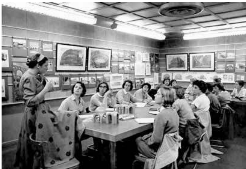
3. Linda Nochlin dans une classe de Vassar College en 1959.

Linda Nochlin. J'ai écrit aussi sur le genre 10 , et d'ailleurs le succès des travaux féministes depuis le début des années 1970 se manifeste notamment par la généralisation des études de genre. Car, même au niveau du premier cycle, il n'y a plus une seule formation universitaire qui n'offre un ou plusieurs cours incluant des approches historiques de l'œuvre d'art fondées sur les études de genre.