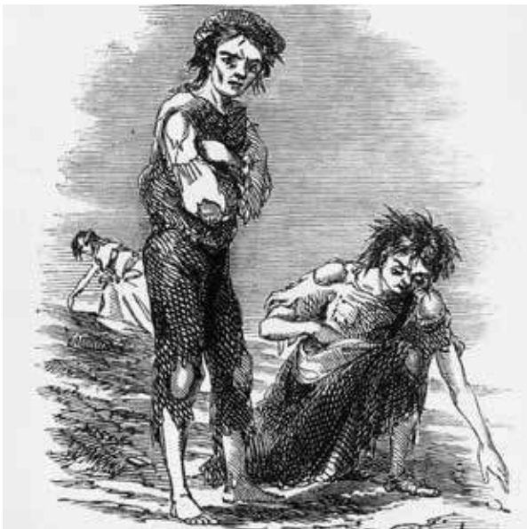
7. « Boy and Girl at Cahera », dans The Illustrated London News , 20 février 1847.

Todd Porterfield. Comment se profile votre livre ?