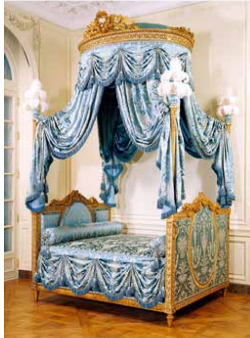
3. Lit à la polonaise, vers 1775-1780, noyer enduit, acier doré, tapisserie et passementerie de soie moderne, plumes d'autruche, Los Angeles, The J. Paul Getty Museum.

Apparaissant à la Renaissance, l'importance sociale et culturelle du lit s'est renforcée au XVIII e siècle ; en France et en Angleterre, il représente désormais l'objet le plus précieux d'un intérieur, pour presque toutes les classes de la société 24 . Les rideaux de lit, dont la diffusion s'étend de Byzance jusqu'aux débuts des Temps modernes, isolaient le lit, en faisaient un espace dans l'espace et exposaient leurs propres murs textiles 25 dont les grandes surfaces se prêtaient à recevoir des tissus décorés de motifs et des images textiles (broderies, tapisseries, etc.). La noblesse cherchait à manifester les propriétés textiles de ses lits de parades, grâce aux baldaquins, chevets, lambrequins et courtépointes. Ainsi un tapissier parisien du XVIII e siècle faisait-il