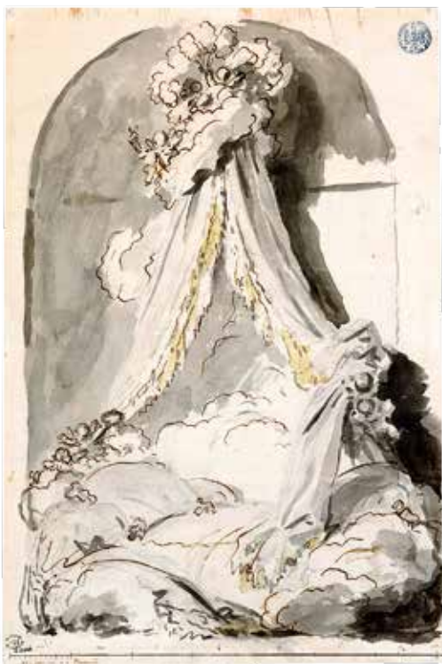
2. Jean-Honoré Fragonard, Le Lit aux amours , vers 1765-1770, plume et encre brune, lavis gris, rehauts d'aquarelle jaune et rose, Besançon, musée des Beaux-Arts et d'Archéologie.

Comme les vêtements, les textiles du lit alternent, au gré des manipulations quotidiennes auxquelles ils sont soumis, entre différents états. Tous les textiles sont soumis à cette variabilité mais, dans le cas du lit, celle-ci est portée aux extrêmes : de l'ordre au chaos, de la règle à l'irrégularité mais aussi dans un jeu réciproque d'une soumission à la convention à la transgression. Le lit défait porte en lui-même la connotation négative du chaos, lui-même associé aux représentations de l'irrégulier, de l'amorphe, du disharmonieux et en fin de compte du laid 21 . Par opposition, le lit fait renvoie toujours à l'ordre créé par l'homme, le plus souvent associé à la ligne et à la géométrie. Notre projet, dans les pages qui suivent, est d'ouvrir la discussion, à partir du lit, sur la figure hybride du textile, entre image et objet, forme et informe, surface et profondeur. Dans le domaine de la peinture, en effet, le lit se rapproche, en référence au corps du peintre ou