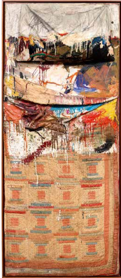
5. Robert Rauschenberg, Bed , 1955, huile et crayon sur oreiller, édredon et drap sur support en bois, New York, Museum of Modern Art.

Le lit de Lina Loos est un exemple précoce du lit-plateau moderne, qui s'est répandu depuis le début du XX e siècle, mais surtout dans sa seconde moitié 44 . Dans un lit-plateau, l'ornement textile signifie la régularité de la surface, comme c'est également le cas dans l'œuvre iconique de Rauschenberg, Bed (fig. 5). Dans ou sur le lit, des opérations qui consistent à tirer, étendre et couvrir, se déroulent et le transforment en un espace vivant, intime, public ou réglé, comme Els van Dongen l'a montré dans une étude sur des patients de maisons de retraite et de clinique 45 . Dans le cas des lits-plateaux, draps, cou- vertures et oreillers sont fréquemment recouverts d'un dessus-de-lit ou d'un couvre-lit aux motifs voyants. Ils sont ainsi transformés en un bloc géométrique, clos sur eux-mêmes et ornements. Ainsi, Bed déploie l'ordre géométrique du couvre- lit sur le chaos des draps qu'elle dissimule. Par son format d'environ 190 sur 80 cm, la combine painting montre le lit comme un équivalent