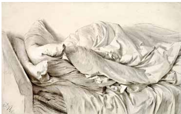
1. Adolph Menzel, Ungemachtes Bett [Lit défait], vers 1845, crayon estompé sur papier gris-vert, Berlin, Staatliche Museen, Kupferstichkabinett.

On peut situer les images métamorphiques des éléments textiles du lit dans cette simultanéité du Romantisme et du Réalisme qui, pour Dario Gamboni, définit le milieu du XIX e siècle. La recherche d'un équivalent de la réalité passait par un intérêt renouvelé pour les aspects matériels et gestuels de la peinture et du dessin, « faisant entrer en jeu une opacité et une suggestivité qui remettent en question la représentation 13 ». Le rendu du réel cesse d'être univoque, et la genèse de l'image perce au premier plan – pour l'artiste aussi bien que pour le spectateur. À la même époque, la théorie de l'art montre une prédilection pour le chaotique et l'informe 14 . Les images de lit que nous venons de décrire permettent de définir cette conception de l'image comme une conception de nature textile.