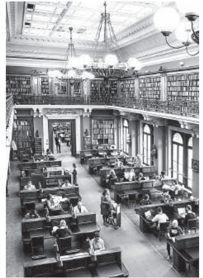
1. La salle de lecture de la National Art Library, Londres, Victoria and Albert Museum.

Julius Bryant. Les bibliothèques d'arts appliqués ont-elles encore un rôle à jouer dans l'univers éducatif numérique du XXI e siècle ? Peuvent-elles par exemple définir les paramètres du sujet par le biais de leurs collections, alors que les étudiants et les créateurs sont en quête d'informations sur des thèmes plus larges tels que l'urbanisme, le design à dimension sociale et les produits numériques ?