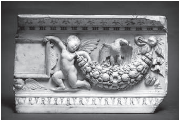
3. Metropolitan Hungarian Royal Architectural Technical School (atelier), Frise de la Renaissance , moulage en plâtre, début du XX e siècle, Budapest, Schola Graphidis Art Collection.

du champ de recherches pour leurs utilisateurs. En République tchèque, diverses grandes bibliothèques d'art permettent d'accéder à ces bases de données spécialisées.