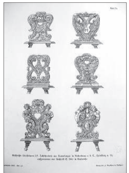
2. Modèles de fauteuils et autres objets en bois (sources inconnues), collés sur carton et classés par matériaux dans la collection d'ornements et de modèles de la bibliothèque du musée des Arts décoratifs de Prague.

Outre les catalogues, on dispose également de bases de données concernant les publications sur l'art – monographies ou articles – telles que JSTOR ou Art Source. En fonction de leur budget, les universités et les bibliothèques peuvent s'abonner à diverses bases de données (ou se regrouper afin de tirer le meilleur parti de leurs ressources), ce qui affecte l'étendue