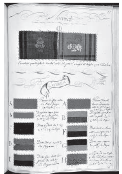
5. Moccafi, Esposizione delle manifatture di Francia, Inghilterra ed Olanda... , page d'un album d'échantillons textiles avec des annotations manuscrites de l'auteur, fin du XVIII e siècle, Paris, bibliothèque Forney.