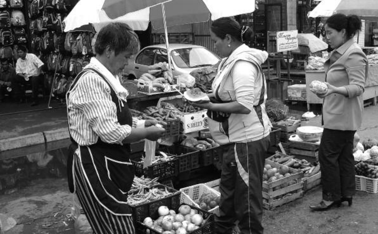
Vente de légumes russes et de fruits chinois sur le marché chinois à Irkoutsk en 2005.