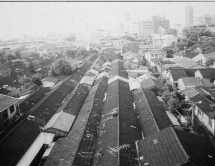
Une photo aérienne de juancun dans la ville de Tainan (1993). © Shang Tao-ming