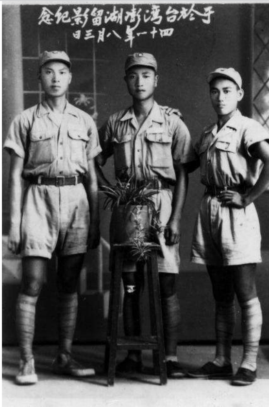
Trois soldats dans la vingtaine, originaires de la province du Guangxi et membres de l' « armée de la jeunesse » ( Qingnian jun ) du KMT. Ils étaient adolescents lorsqu'ils quittèrent, en 1944, écoles et familles pour rejoindre l'armée et combattre les Japonais. Cette photo fut prise à Makung (Îles Pescadores) en 1952.