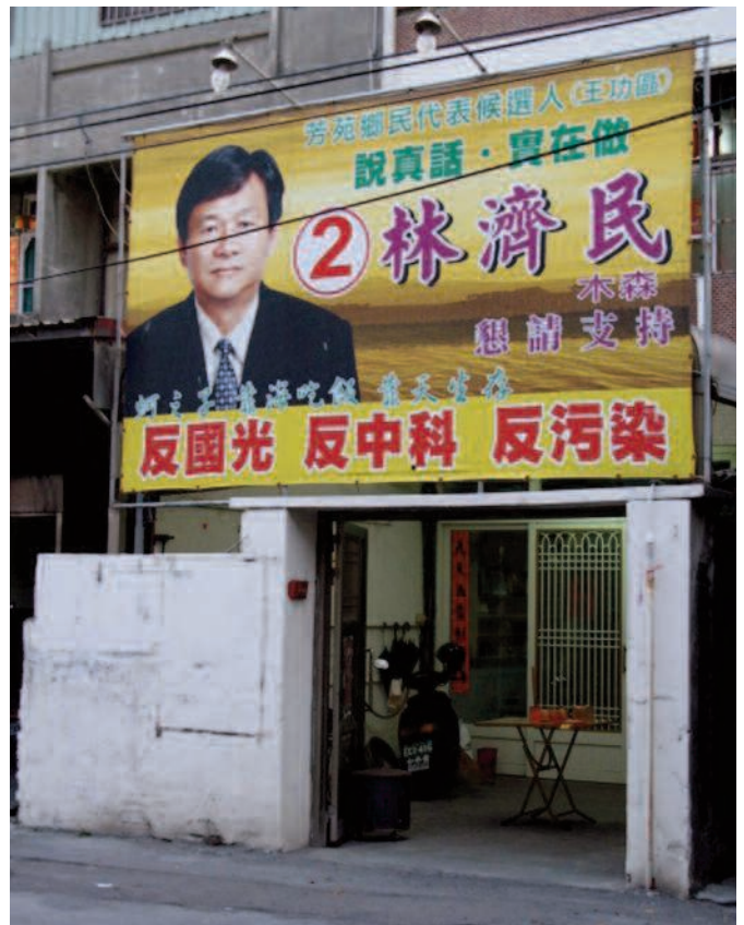
Photo 2 – Un homme politique anti-Kuokuang dans l'arrondissement de Fangyuan. Le succès du mouvement anti-Kuokuang s'explique en partie par la forte opposition locale au projet. Ce candidat affiche sa conviction pour la lutte contre la pollution durant la campagne.

la China Petroleum Corporation considérait Pingtung comme la meilleure option disponible. Su Chia-chuan resta sur ses positions, contrecarrant ainsi les plans de construction du nouveau vapocraqueur. Le cas de Pingtung demeura unique dans la mesure où l'opposition de principe d'un responsable politique local permit d'empêcher l'industrialisation pétrochimique malgré une faible mobilisation de la société civile.