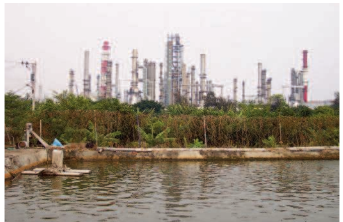
Photo 1 – Le vapocraqueur n° 3 de la China Petroleum Corporation dans le district de Linyuan. Les installations pétrochimiques de Taiwan sont souvent situées près de terres agricoles. Cette image montre un bassin de pisciculture proche d'un complexe industriel.

Dans la seconde moitié de l'année 1999, la China Petroleum Corporation dirigea brièvement son attention vers Chiayi (voir ci-dessous), avant de tenter sa chance à Pingtung en 2002. Tout comme Formosa Plastics avec Yilan,