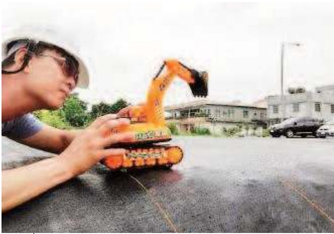
Figure 4 – Mise en scène de la démolition de la résidence de Liu Cheng-hung par l'internaute Kuso.

de la terre", c'est le prochain critère d'évaluation pour être chef de district cinq étoiles (41) .