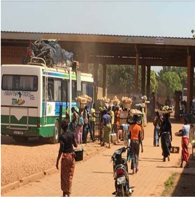
39 Taxi-moto, vendeurs ambulants et marchandises diverses