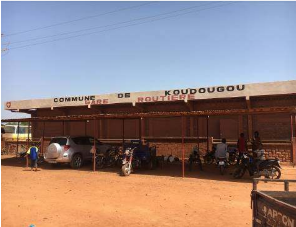
27 Grand hangar