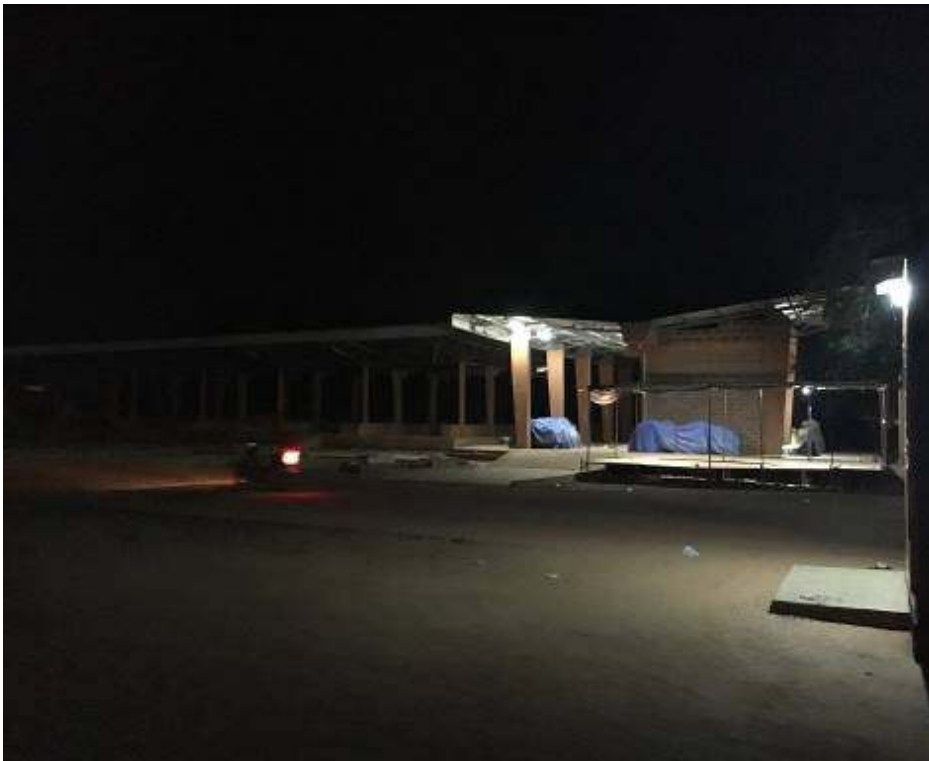
67 Service eau potable