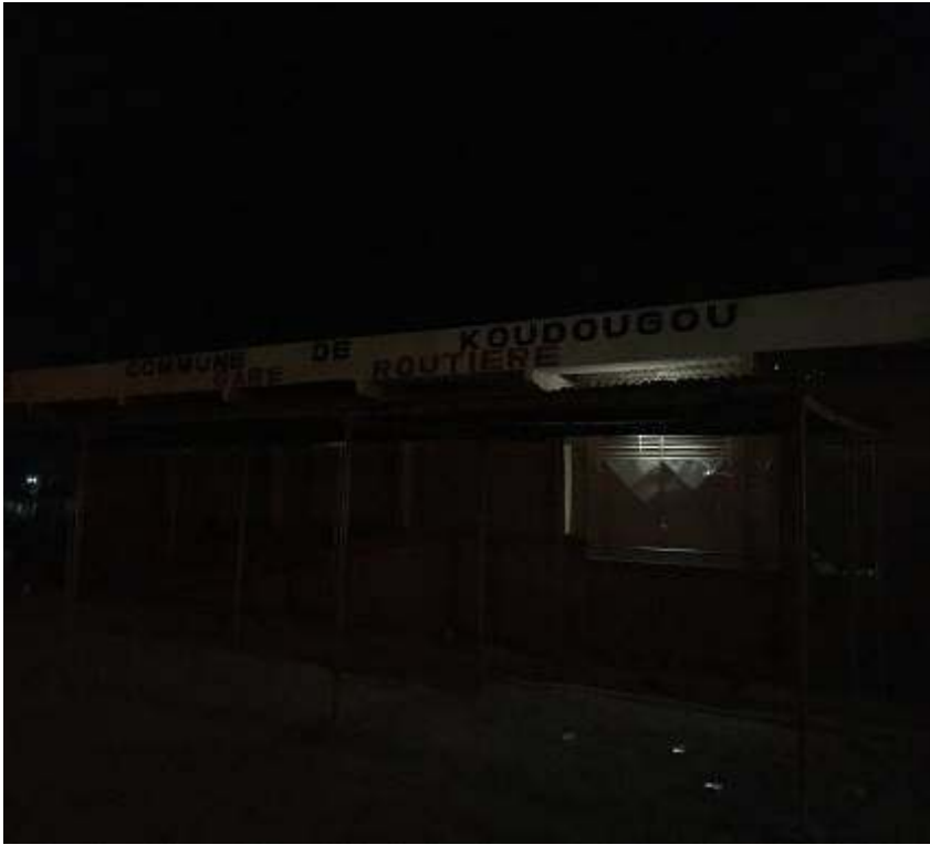
66 Grand hangar de nuit