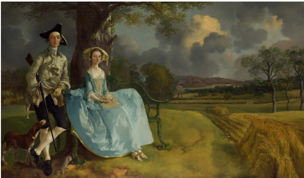
T. Gainsborough, Mr and Mrs Andrews (c. 1750), huile sur toile, 69,8x119,4cm, National Gallery, Creative Commons

En ouvrant son poème ekphrastique sur le bruit des oiseaux, le poète insiste sur la fascination de Gainsborough pour la nature et la peinture de paysage. Grâce à cet aspect sonore, nous pénétrons dans le paysage et ne restons pas observateur face au tableau, hors de celui-ci.