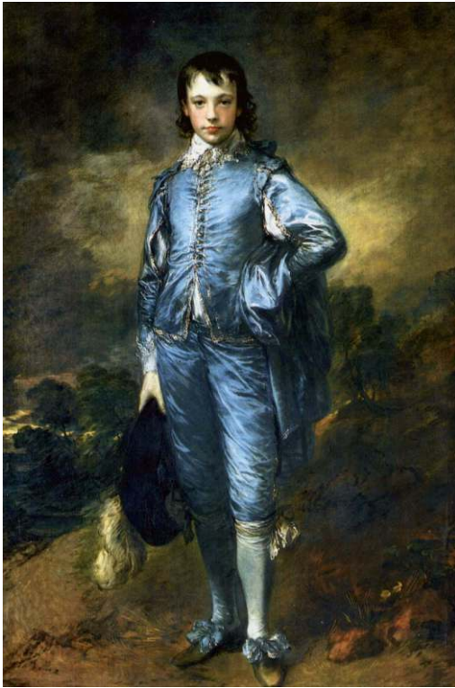
Thomas Gainsborough, Boy in Blue (c. 1770), huile sur toile, 177,8x112,1cm, Huntington Library , San Marino, California, Creative Commons