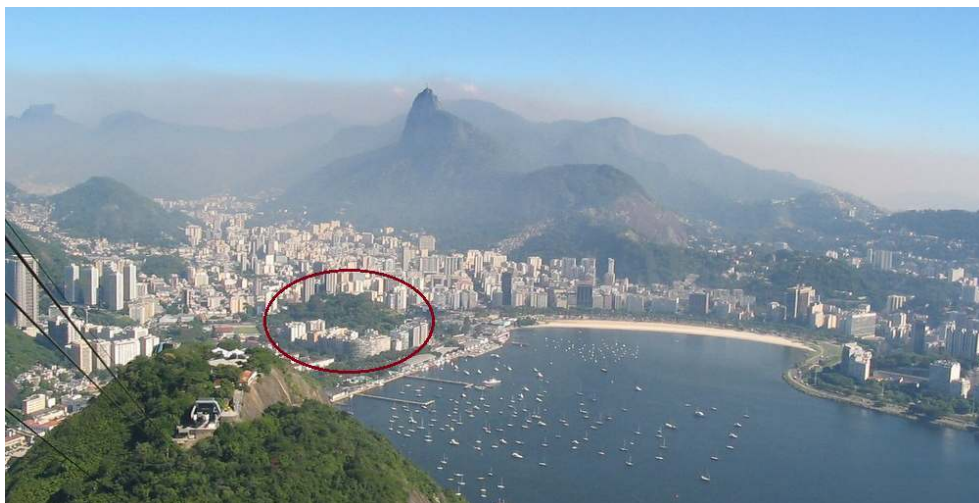
Figura I: Aspecto contemporâneo da enseada de Botafogo, com destaque para a localização do Morro do Pasmado.