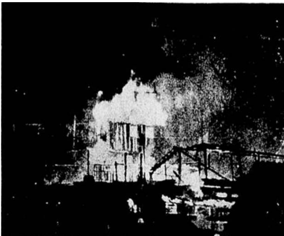
Figura II: Fotografia sem indicação de autoria (provavelmente, de Manuel Gomes da Costa) retratando o incêndio do Pasmado, aparecida no Correio da manhã em 25/01/1964. (p. 3), junto à matéria "Fim do pasmado".

recente, que assiste a uma ressurgência dos discursos que pregam transferências populacionais de favelas do Rio de Janeiro, no bojo das preparações da cidade para sediar, em 2014, a Copa do Mundo de Futebol e a Olimpíada, em 2016. Em boa parte desses estudos, breves menções à Favela do Pasmado, que reconheciam-lhe o caráter paradigmático, contrastavam com a dificuldade em encontrar trabalhos que a considerassem especificamente.