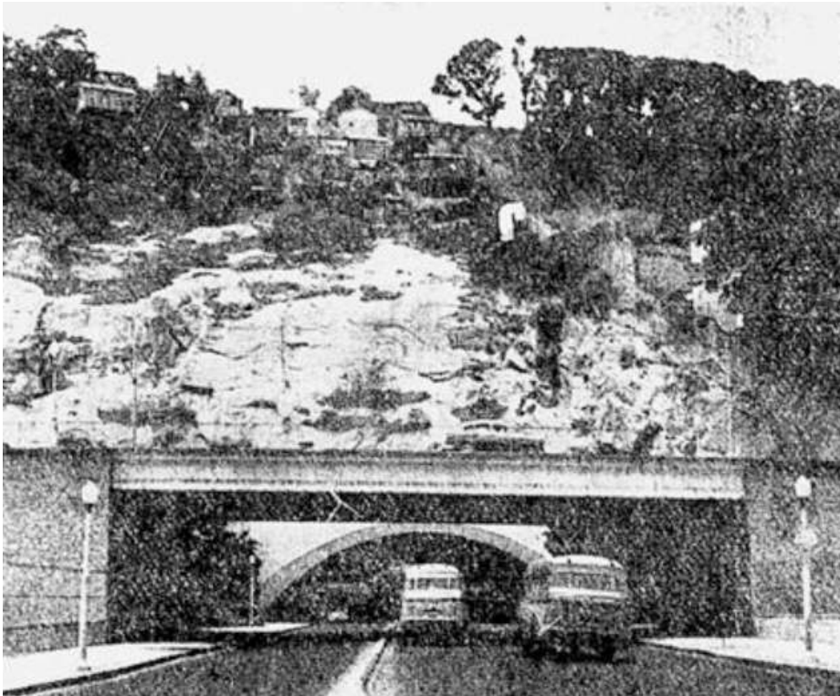
Figura V. O Correio da manhã, em matéria de capa da edição de 23/03/1959 estampava o seguinte: “Crescem as favelas da cidade não obstante promessas em contrário da municipalidade”, anunciando um libelo que ocuparia quase toda a página.

As riquíssimas relações semânticas oferecidas em um trecho tão curto dão uma ideia da agressividade do Correio da Manhã no ano imediatamente anterior à consumação da remoção da Favela Pasmado, e encerram praticamente todo o repertório de opróbios contra o favelado a que se poderia recorrer. O mais interessante, porém, é a implicação de que, se os favelados não são capazes de parar de usar o álcool — algo tão obviamente distinto do beber — de poupar a mais insignificante das somas, se não são capazes de coexistir com o mal, como o fazem pessoas boas em qualquer outra parte, é necessário que sejam salvos de si próprios — um estado semelhante à infância — pela ação enérgica do estado, que é chamado a coibir a burla da lei e urbanizar as favelas, esperando-se que a população favelada, outrora arredia, viesse a perceber, na benemerência dos seus mais combativos opositores, a redenção de sua severidade.