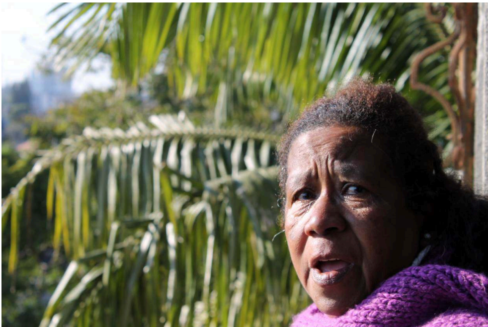
“Ele me chamava ‘negrinha’. Eu tinha uns nove meses. Ele era uma pessoa de idade, diz que ele enxergava coisas, se assustava [...]. Então ele carregava eu no colo, a minha mãe disse que às vezes me procurava, ele tava numa cadeirinha de balanço, sentado, comigo no colo. [...] A minha mãe perguntava: ‘mas o que o senhor quer com essa criança no colo?’, e ele dizia: ‘com ela no colo, eles não vêm me pegar’. E a minha mãe começou a notar algo em mim”. Foto: Simone Assis, 2016.