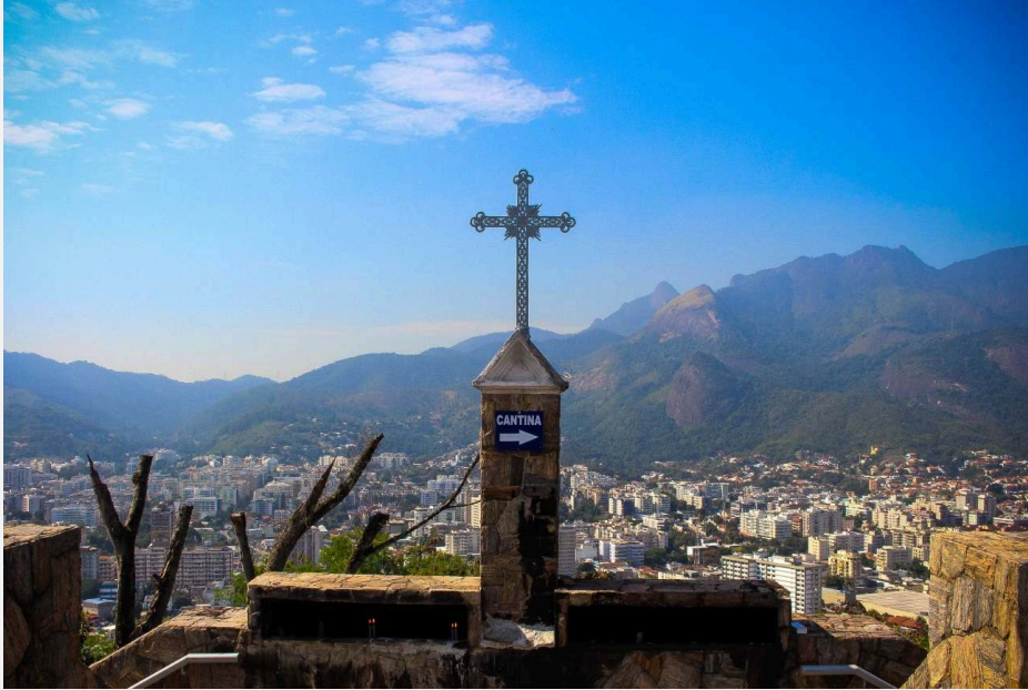
Vista da Igreja Nossa Senhora da Penna