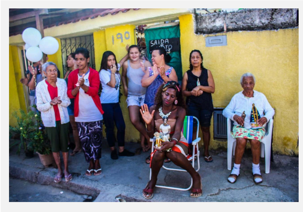
Fiéis aguardam as bênçãos durante a procissão de Corpus Christi

FONTE: Izabelle Vieira, 31 de maio de 2018.