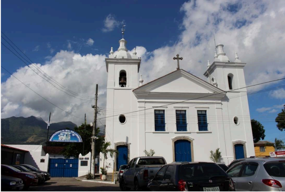
Igreja do Loreto