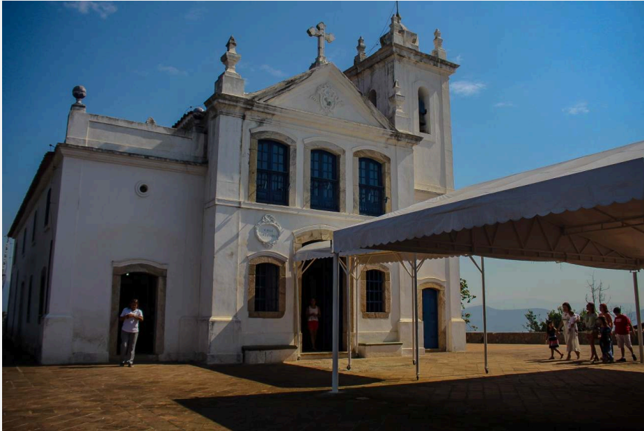
Igreja Nossa Senhora da Penna

FAMÍLIAS COMEÇAM A CHEGAR PARA UM BATIZADO NUMA MANHÃ DE SÁBADO.