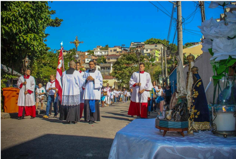
Procissão de Corpus Christi na rua Claudino de Oliveira

FONTE: Izabelle Vieira, 31 de maio de 2018.