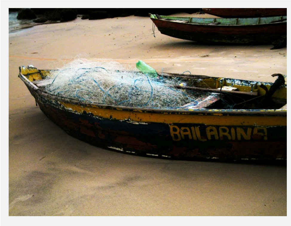
MONTARIA NA PRAINHA, SALVATERRA