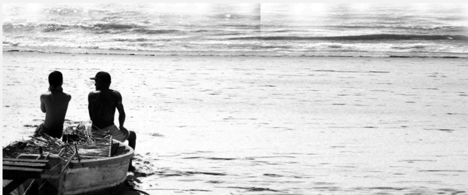
AVÔ E NETO NA PRAIA GRANDE, SALVATERRA