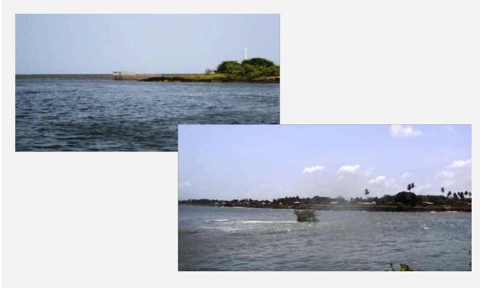
IMAGENS DO FAROL DE SALVATERRA