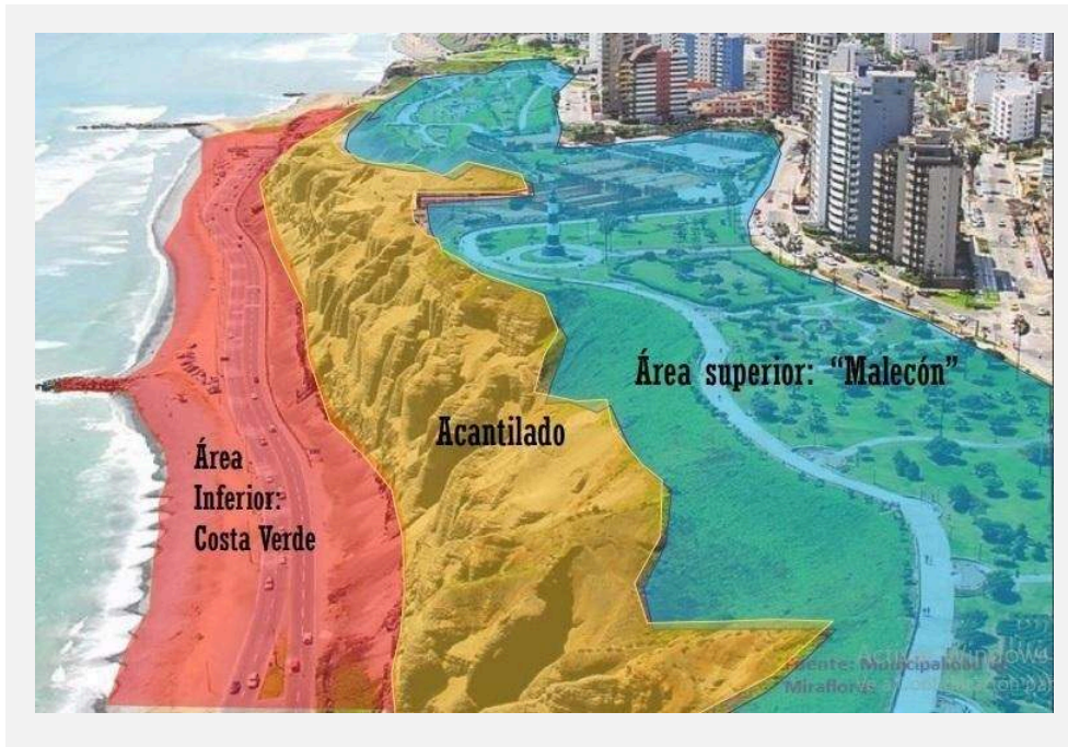
CONFIGURACIÓN ESPACIAL DEL FRENTE COSTERO, ÁREA MIRAFLORES.