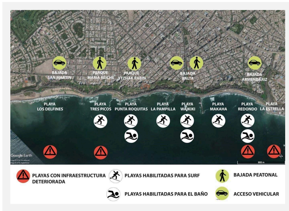
ACCESO Y USOS DEL ÁREA DEL FRENTE MARÍTIMO DE MIRAFLORES.