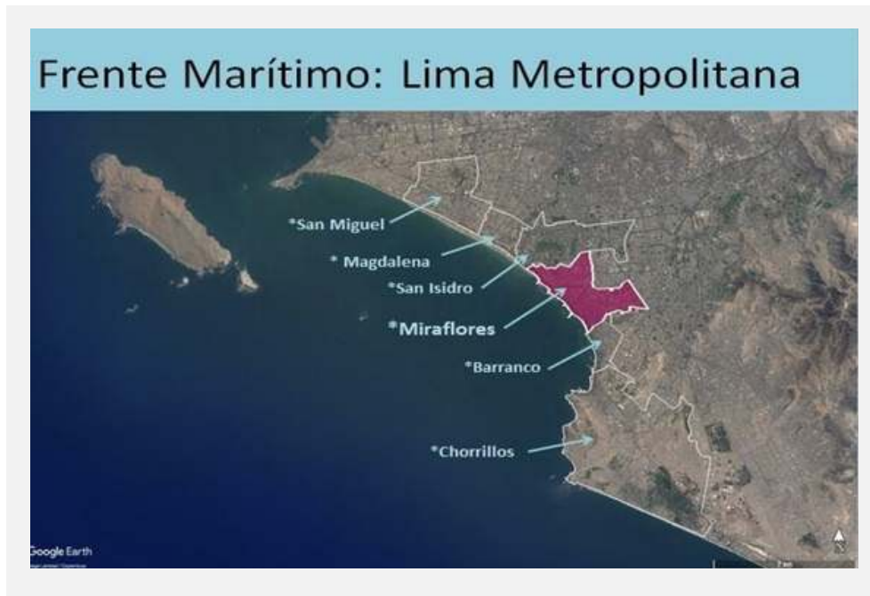
ÁREA D EL FRENTE MARÍTIMO DE MIRAFLORES.