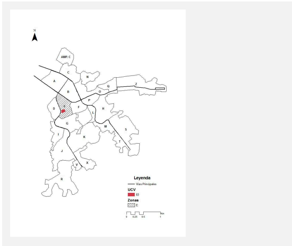
UBICACIÓN DE LA UCV 83 DE LA ZONA E DE HUAYCÁN

largo de sus biografías. Este espacio pertenece a la zona “E” una de las que fueron ocupadas durante el primer año de fundación.