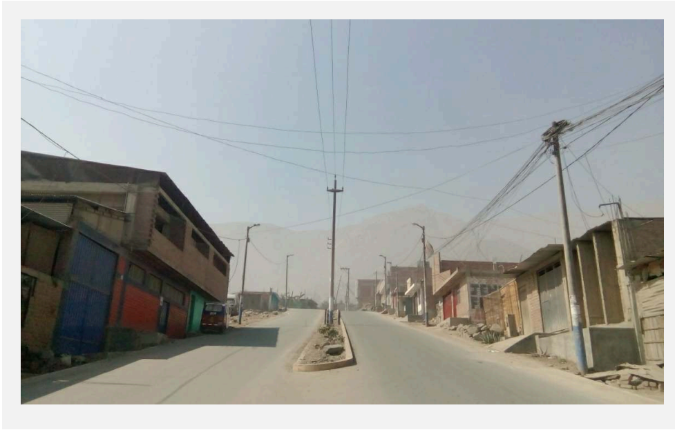
LOTE DE MARLYN EN UNA AVENIDA PRINCIPAL DE "LOS ÁLAMOS"

y un mayor beneficio del terreno como la ubicación en una avenida principal y un mayor tamaño.