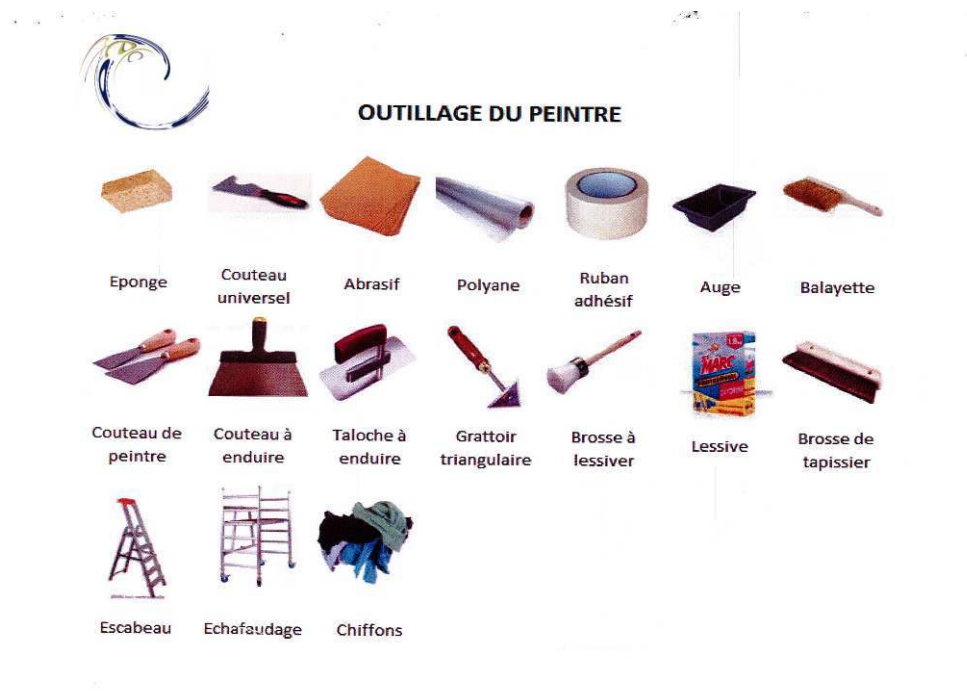
Figure 1. Fiche « Outillage du peintre »