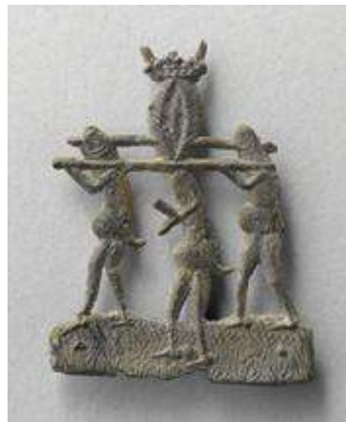
Illustration 11 Enseigne, XV e siècle, Paris, Musée national du Moyen Âge.