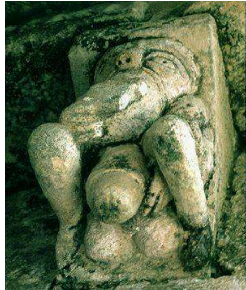
Illustration 9 Modillon de l'église de Champagnolles, XIII e siècle.